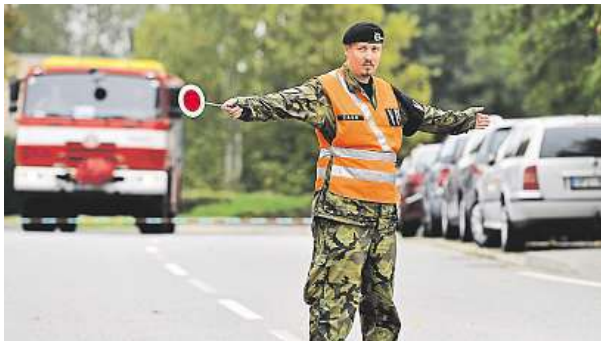
Armáda kvůli explozi uzavřela okolí akademie.

V areálu Vojenské akademie ve Vyškově se včera dopoledne ozvala exploze. Podle dostupných informací vybuchl granát. Na místě zůstal jeden voják mrtvý, druhý byl zraněn. „V místě vybuchlo několik granátů. Všechny nás evakovali. Jeden voják je úplně rozervaný,“ uvedla pro Vyškovský deník Rovnost jedna z příslušnic dědičné vojenské posádky. Ředitel odboru komunikace ministerstva obrany Jan Pejšek uvedl, že předběžná šetření ukazují, že se nejednalo o teroristický útok nebo úmyslný čin. K výbuchu podle něj došlo ve veřejně nepřístupných sklepních prostorách v administra-