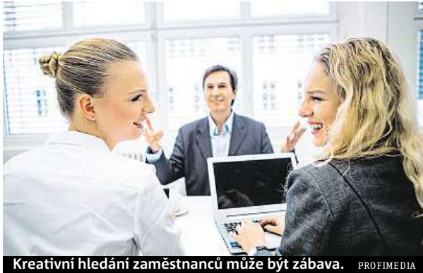
Kreativní hledání zaměstnanců může být zábava.

Klíčový je inzerát. Jednou z možností je vytvořit všeobecný inzerát, který bude začínat třeba slovy „Chci pracovat v...“ a dosadíte si jméno své firmy. Nemusíte se zaměřovat přímo na danou pozici. „Zmíňte pozice, které jsou momentálně otevřené, ale také povzbudte ty, kteří ideální pozici nenašli, aby se také přihlásili,“ radí Lucie Spáčilová, trenérka seminářů na téma najímání a hodnocení zaměstnanců a výkonná ředi-