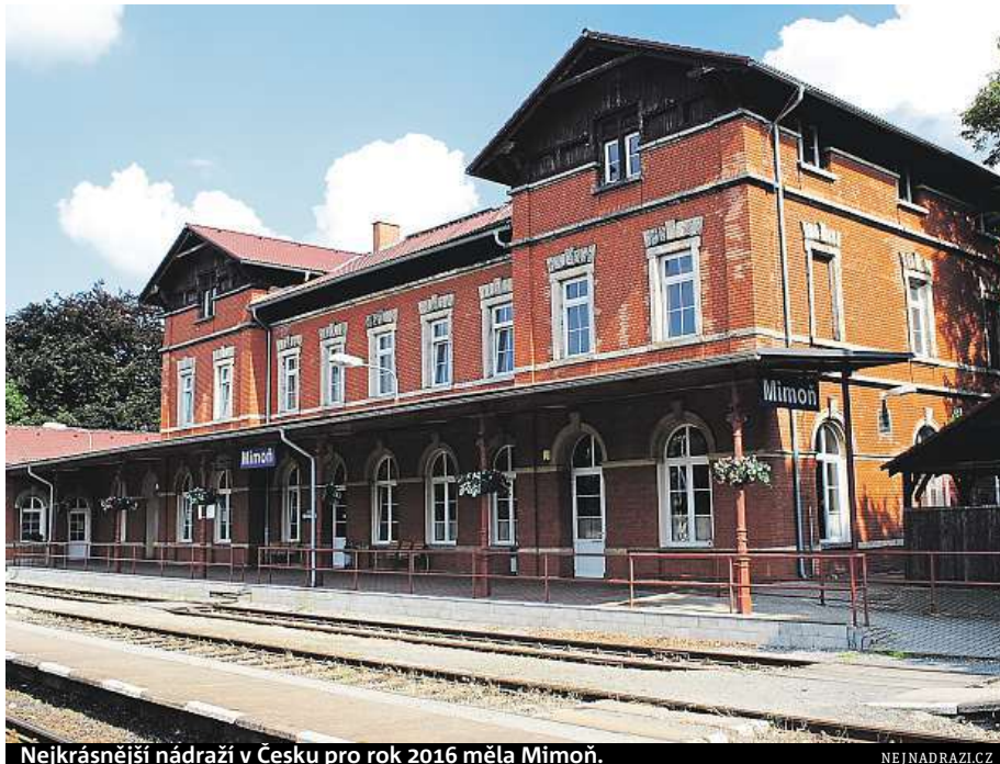
Nejkrásnější nádraží v Česku pro rok 2016 měla Mimon.

Už po jedenácté Česko hledá „Miss“ nádraží. Soutěž o titul Nejkrásnější nádraží, která od včerejška zná desítku finalistů, je podle pořadatelů prezentací dobrých příkladů v péči o prostředí železničních stanic a zastávek. Anketa má motivovat obce, města a správce nádraží k zodpovědnější péči o budovy a jejich okolí. „Soutěží chceme děkovat a chválit. Každoročně hlasují tisíce lidí. Stanice se proměňují a lidé si toho všímají. Zaměstnanci si uvědomují, že si lidé jejich práce váží, a to je smysl soutěže,“ říká Drahomíra Kolmanová, organizátorka celého projektu. Hlasovat můžete na webu Nejnadrazi.cz . MAREK HÝŘ