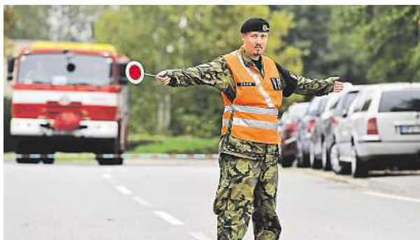
Armáda kvůli explozi uzavřela okolí akademie.

V areálu Vojenské akademie ve Vyškově se včera dopoledne ozvala exploze. Podle dostupných informací vybuchl granát. Na místě zůstal jeden voják mrtvý, druhý byl zraněn. „V místě vybuchlo několik granátů. Všechny nás evakovali. Jeden voják je úplně rozervaný,“ uvedla pro Vyškovský deník Rovnost jedna z příslušnic dědičné vojenské posádky. Ředitel odboru komunikace ministerstva obrany Jan Pejšek uvedl, že předběžná šetření ukazují, že se nejednalo o teroristický útok nebo úmyslný čin. K výbuchu podle něj došlo ve veřejně nepřístupných sklepních prostorách v administra-