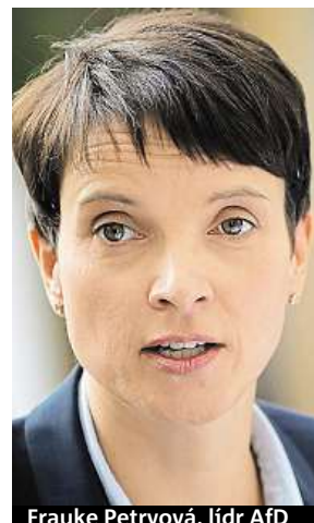
Frauke Petryová, lídr AfD