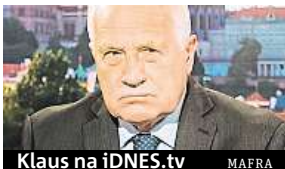
Klaus na iDNES.tv

je v Německu,“ prohlásil. Klaus je aktivním podporovatelem strany Alternativa pro Německo, která je označována za populistickou. Řeč byla i o brexitu. Před hlasováním Klaus předpovídal, že Britové v EU zůstanou. „Jsem rád, že jsem se mýlil. Je to projev moudrosti a vyzrálosti občanů Velké Británie,“ řekl. Doufá, že brexit povede k „probrnění Evropanů“. iDNES.cz