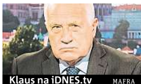
Klaus na iDNES.tv

je v Německu,“ prohlásil. Klaus je aktivním podporovatelem strany Alternativa pro Německo, která je označována za populistickou. Řeč byla i o brexitu. Před hlasováním Klaus předpovídal, že Britové v EU zůstanou. „Jsem rád, že jsem se mýlil. Je to projev moudrosti a vyzrálosti občanů Velké Británie,“ řekl. Doufá, že brexit povede k „probození Evropanů“. iDNES.cz