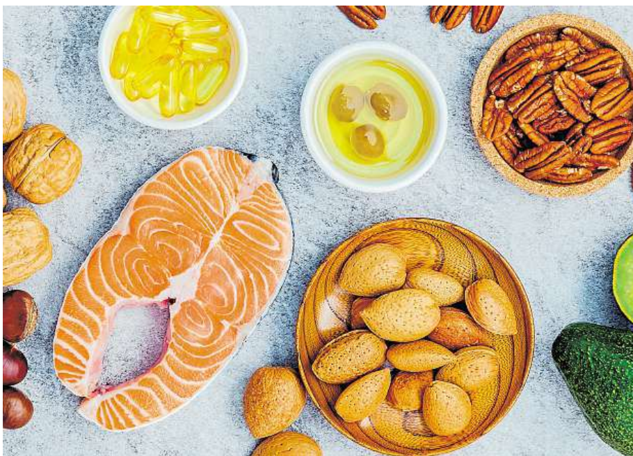
Při vysoké hladině LDL-cholesterolu mají být mořské ryby na jídelníčku často.

Na tyto prohlídky ale mnoho lidí nechodí, tedy se o svém počínajícím problému nedozví. Jinak než z krevního rozboru se totiž hladina cholesterolu určit nedá. Přitom vysoké hodnoty napomáhají rozvoji aterosklerózy neboli kornatění tepen, které vede ke kardiovaskulárním onemocněním.