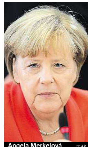
Angela Merkelová

CDU dopadla v Berlíně ještě hůř než nedávno v Meklenbursku, hodnotí německý tisk výsledek nedělních voleb. Strana kancléřky Angely Merkelové přišla na radnici o osm křesel, odpůrci migrace z AfD jich získali 25. Důvod k oslavám nemá ani primátor Müller. Jeho SPD sice vládu nad Berlínem udrží, ale s nehorším výsledkem ve svých dějinách.