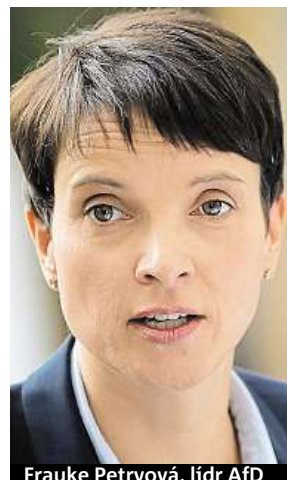
Frauke Petryová, lídr AfD