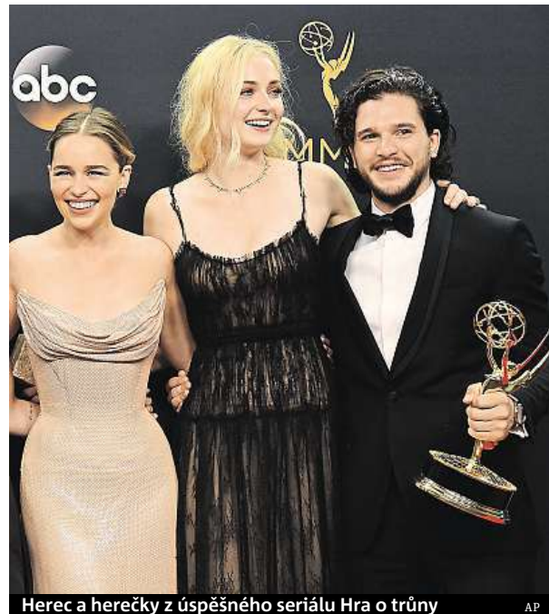
Herec a herečky z úspěšného seriálu Hra o trůny

Celkově už populární fantasy série posbírala rekordních 38 sošek těchto televizních cen.