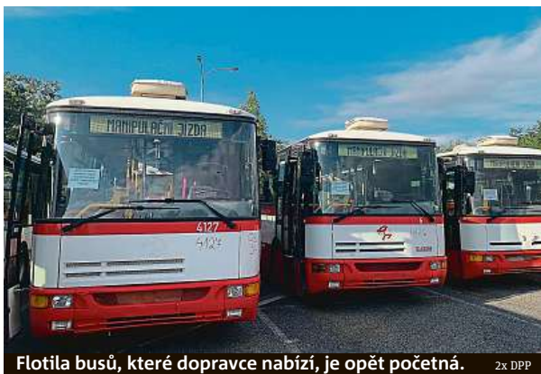
Flotila busů, které dopravce nabízí, je opět početná.

„V přehledu nabízeného majetku je uvedeno také vybavení jako rozvaděče, regloskop, válcová zkušebna brzd, nástavba na vysokozdvizný vozík, šroubový kompresor, vrtačky či elektrický kladkostroj. Dále také pila, hydraulicko-pneumatický zvedák, telefony, bruska, průmyslový vysavač či mycí box z vozovny Hloubětín,“ vyjme-