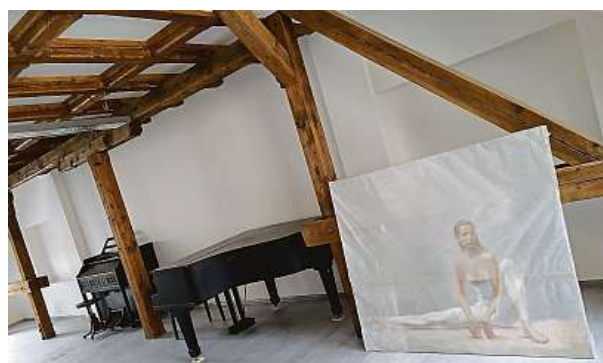
Interiér ozdobí obrazy akademického malíře Milana Meda.

Nové prostory si Schneider chválí. Bývalý pivovar má navíc stále unikátní genius loci. „Zůstaly tu původní dřevěné i kovové prvky a industriální ozdoby. Památkově chráněná budova byla zrekonstruována opravdu citlivě,“ říká manažer konzervatoře. Majitel areálu myslel i na originální detaily. Některá stropní světla jsou například vyrobena z komponentů bývalé varny.