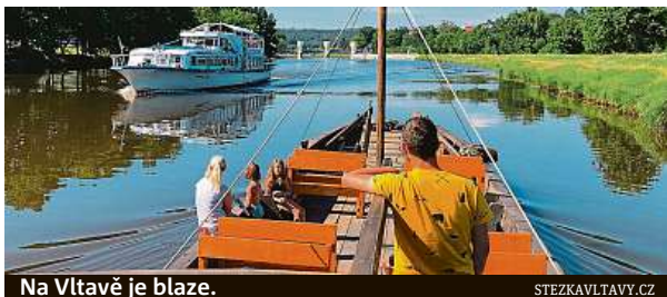
Na Vltavě je blaze.

Vltavská vodní cesta na Budějovicích otevře své služby. Zcela zdarma.