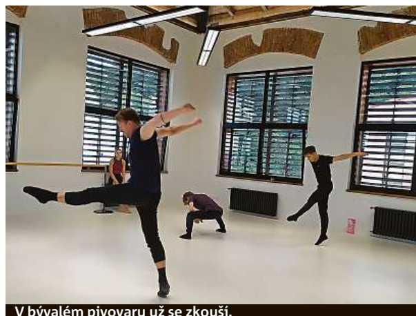
V bývalém pivovaru už se zkuší.

Majitel areálu, akciová společnost Braník Pivovar, původně plánoval budovu pronajmout IT firmám, nakonec se ale rozhodl pro taneční vzdělávací instituci. S konzervatoři si pláclí letos v lednu. Několik měsíců se pak pivovar měnil v uměleckou školu. Za pár týdnů, tedy od začátku školního roku, se už konzervatoř otevře studentům. Ti tu najdou hned čtyři baletní studia, čtyři třídy, posilovnu, rehabilitační zázemí a jídelnu.