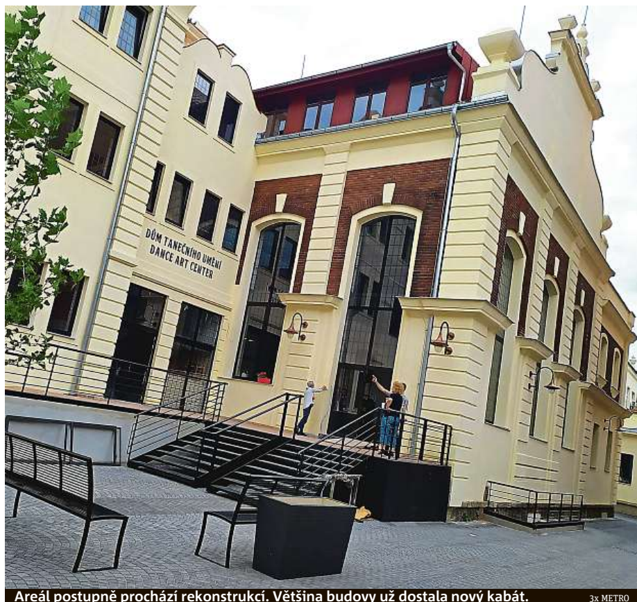
Areál postupně prochází rekonstrukcí. Většina budovy už dostala nový kabát.