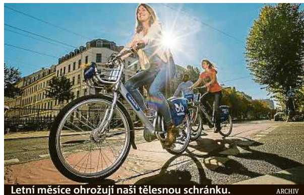
Letní měsíce ohrožují naši tělesnou schránku.

O tom, že je pohyb důležitý v každém věku, není pochyb, a to nejen kvůli skutečnosti, že snižuje riziko civilizačních chorob, jako jsou srdeční onemocnění, diabetes druhého typu nebo demence. Pokud už máte pár křížků na pažbě, kila navíc nebo jste