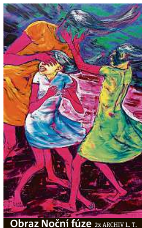
Obraz Noční fúze 2x

Chodil jsem za taneční. Tancovat neumím. Tanec je pro mě ale jako malíře ideální námět, jelikož se v něm dá znázornit pohyb, rychlost, gesto. Upřímně řečeno, nikdy by mě nenapadlo, že se zpodobněním tance budu zabývat. Ale už to, že mohu malovat, jak se při pohybu dívkám vlní šaty, jako ve větru, či jim pohybem vlají vlasy, to všechno jsou dynamické po-