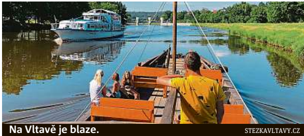
Na Vltavě je blaze.

Sobotní program festivalu Lodě na vltavské vodě je určen pro širokou veřejnost a je koncipován tak, aby si lidé mohli vyzkoušet co nejširší nabídku služeb, které přináší