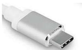
Konektor USB-C

Eurokomisař Verheugen tehdy uvedl, že takový krok bude nezbytný v případě, že