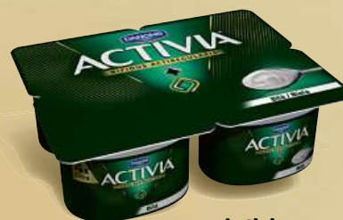
Activia jogurt bílá 4x 120 g