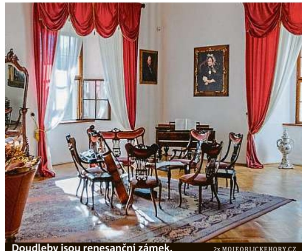
Doudleby jsou renesanční zámek.

Přepychově zařízený zámek Častolovice se může pochlubit renesančním kazetovým stropem v Rytířském sále a sbírkou portrétů českých panovníků. Děti si ale nejvíc užijí minizoo, kde si u vstupu můžete koupit granulky pro krmení zvířat. Lamy, ovečky, poníci, oslíci, ovečky i prasátka na vás budou loudit a doslova vám budou zobat z ruky. Možná si tu