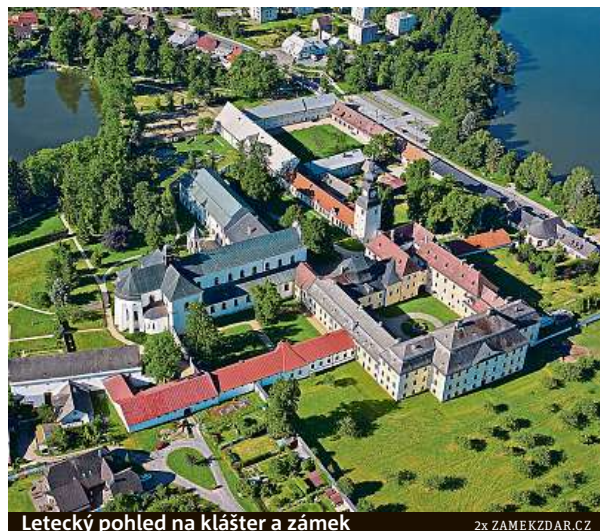
Letecký pohled na klášter a zámek

prosto pohltní díky souhře světlá a stínu nebo dokonale symbolice. Věděli jste například, že když se na kostel po-