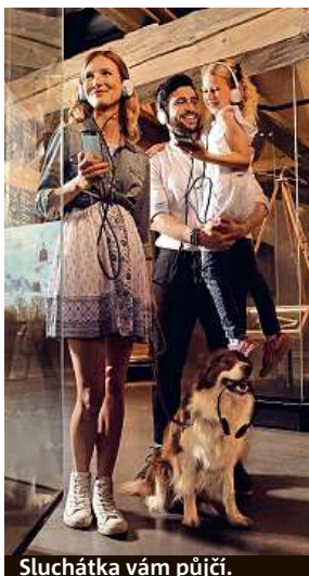
Sluchátka vám půjčí.

Návštěvu areálu si užijí také návštěvníci, kteří mají tradiční památky. Stačí deseti minutová procházka od zámku a jste v kostele sv. Jana Nepomuckého na Zelené hoře. Mimořádná stavba Jana Blažeje Santiniho vás na-