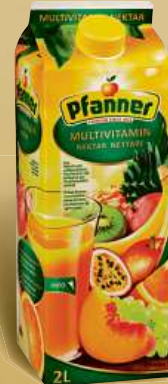
Pfanner multivitamin 2 l