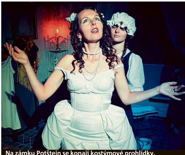
Na zámku Potštejn se konají kostýmové prohlídky.

Kruhové a čtvercové ornamenty sgrafit zachránily zámek Doudleby. Právě díky nim stojí zámek dodnes. Do-