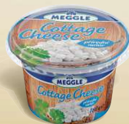
Meggle Cottage 180 g, více druhů