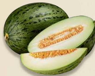
Meloun Piel de Sapo 1 kg, Španělsko