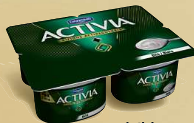
Activia jogurt bílá 4x 120 g