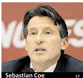
Sebastian Coe

důvěru,“ řekl Coe, který se proslavil i jako šéf organizátorů OH 2012 v Londýně. IDNES.cz