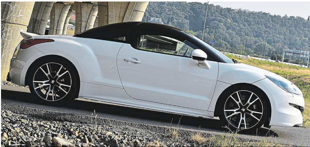
Peugeot kupé RCZ R může být pro hravé muže variantou k Audi TT.

Ještě sportovnější verze RCZ R s přeplňovaným motorem 1.6 THP má 199 kilowattů, což dělá nějakých 273 koní. Ostrá dravá předokolka udělá stovku za 5,9 vteřiny a ostudu vám rozhodně neutrhne. Když prudce šlápnete na plyn, hned víte, s kým máte tu čest. Pro slečinky – byť by se jim kožená palubní deska prošívaná tlustou červenou nití líbila – tohle auto není. Nástup točivého momentu pouze na přední kola je tak mohutný, že ho musíte držet pevně oběma rukama. Při rychlejších předjížděcích manévru může kupátko nepříjemně uskočit, s tím prostě musíte počítat. Řízení vyžaduje zvláštní zacházení, chvílku vám potrvá, než se s autem sžijete. Naštěstí se o korekci směru jízdy stará di-