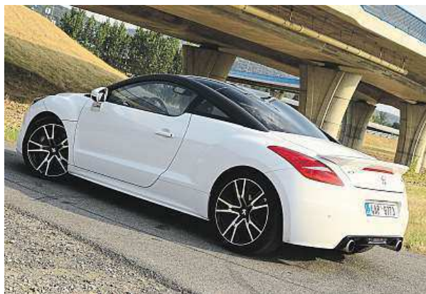
Obsah kufru: 384 litrů

Motor má krásný zvuk, rychlé reakce a jeho hravost podtrhuje i přesné řazení manuální šestistupňové převodovky, kde kovovou kulatou hlavou řadič páky sázíte rychlosti do přesných drah. Stejně jako u zrychlení musíte dávat bacha i při brzdění. Auto je dobře odhlučněné, a třebaže slyšíte řev výfuků, samotnou jízdu už moc ne. Pokud se přistihnete, že na okrese řádíte vysoko nad zákonnou rychlostí a dupnete na brzdou, mohou se obří kotouče o průměru 380 milimetrů trochu vzpírat a auto zaplavě ze strany na stranu.