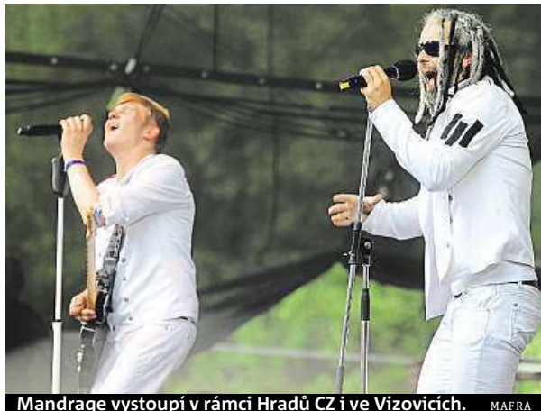
Mandrage vystoupí v rámci Hradů CZ i ve Vizovicích. MAPRA

Putovní festival Hradý CZ zavítá zítra a v sobotu do Hradce nad Moravicí. Lístky ještě stále seženete v předprodejích. Hradý jsou sázka na jistotu, většina interpretů je totiž objíždí všechny. I tentokrát bude k vidění Tomáš Klus, Xindl X či Mig 21. Trochu překvapivý je brzký sobotní čas vystoupení kapely Chinaski, a to již od 13 do 14 hodin. Kapela totiž poté přejíždí na festival Okoř, který pořádá jejich manažerka Han-