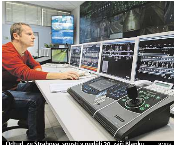
Odtud, ze Strahova, spustí v neděli 20. září Blanku.

ně by podle všeho měl být dobře připraven. „Stavba musí projít zkouškou větrání, signalizace, osvětlení a podobnými zkouškami, aby získala zbývající razítka potřebná pro otevření,“ vysvětluje