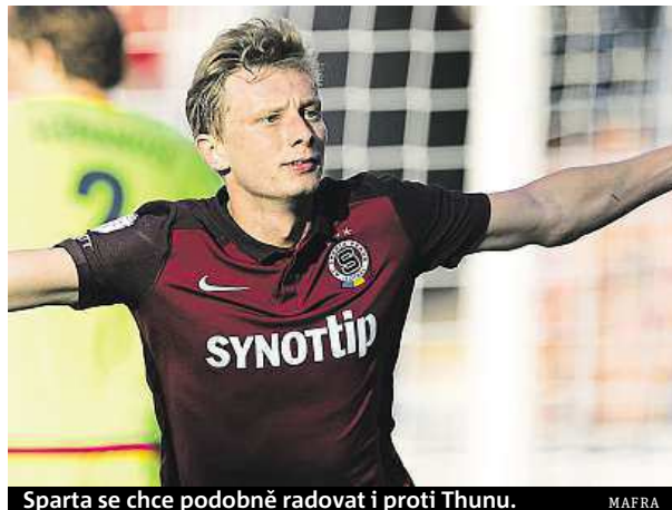
Sparta se chce podobně radovat i proti Thunu.

O postup do skupiny se dnes popere Sparta, Plzeň, Liberec i Jablonec.