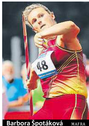
Barbora Špotáková

na závody. Zažila jsem to kdysi na mistrovství světa juniorů, kde jsem byla úplně poslední ze všech, a je to nevědné. Všichni už mají pohodu a jiné myšlenky, zatímco vy se pořád musíte koncentrovat na závod,“ říká Špotáková. Ta by ráda zpět do Česka přivezla jeden z cenných kovů. „Poperu se jako vždycky. Jedu zdravá, připravená, jsem bojovnice, nechám tam všechno. A uvidím, jak to dopadne,“ dodala trojnásobná medailistka ze světových šampionátů. PUR a IDNES.cz