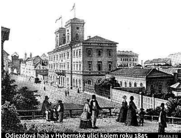
Odjezdová hala v Hybernské ulici kolem roku 1845

Masarykovo nádraží vzniklo jako konečná stanice dráhy z Olomouce do Prahy. Tato trať byla součástí významného spojení Vídně s Prahou. Jeho význam ještě vzrostl v roce 1850 po otevření druhé tratě železnice do Lovosic, Drážďan a Berlína. Třetí železniční trať, která byla na nádraží dovedena, pražská spojovací dráha, je v roce 1872 propojila přes nádraží Františka Josefa, dnešní Hlavní nádraží, se Smíchovem. Empírová architektura