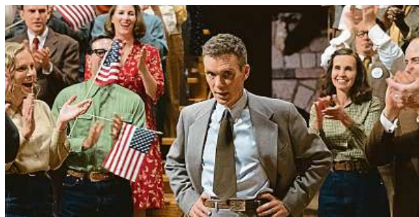
J. Roberta Oppenheimera si zahrál Cillian Murphy.

Nolanův scénář totiž hodně rychle začne budovat, představovat, vysvětlovat a vyprávět. Dělá to zcela vědomě. Je totiž potřeba šlapat na plyn, a to tak šikovně, aby mohl servírovat divákům v poslední třetině filmu hned několik místy