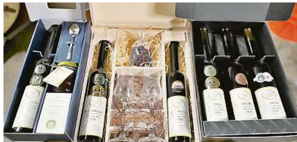
Dárek k narozeninám, k Vánocům, ale i jako pozornost obchodním partnerům. Od ledna podle nových daňových pravidel. MAFRA

Vinaři, především ti menší, ale mají z možného konce dárkových vín do pětistovky jako odečitatelné položky oba-