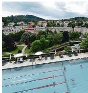
Bazén hotelu Thermal a vyhlídka na Karlovy Vary

„Zápis na seznam kulturních památek světového dědictví UNESCO je důkazem, že jsou Františkovy Lázně unikátním místem světového významu. Přínos pro město je zejména dlouhodobý. Díky tomu, že jsou Františkovy Lázně součástí statku Slavná lázeňská města Evropy (GSTE), mají památky větší šanci na jejich za-