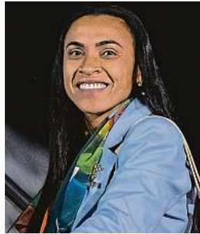
Splní si brazilská fotbalistka Marta sen o titulu?

„Vždycky tu bylo zhruba deset elitních týmů, ale ostatní se stále přibližují. Už neuvidí-