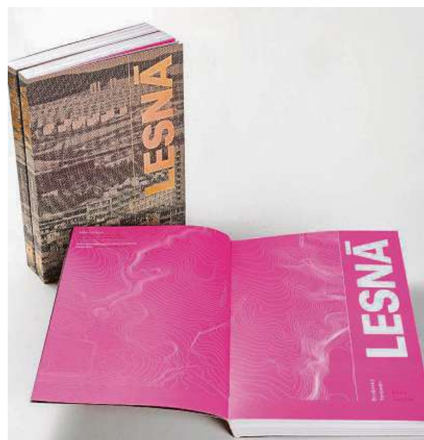
Brněnský fenomén Lesná