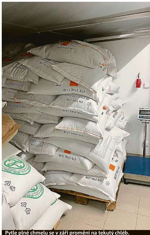
Pytle plné chmelu se v září promění na tekutý chléb.