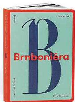
O umění v Brně 2x TIC BRNO

Brno nás někdy ohromí, jindy pobaví, často mu ale nerozumíme. Jasně do něj chce vnést Brnboniéra, nová publikace vydaná TIC BRNO, která si klade za úkol představit umění na veřejně přístupných místech.