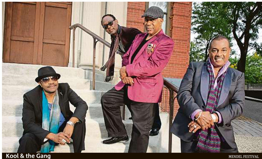
Kool & the Gang