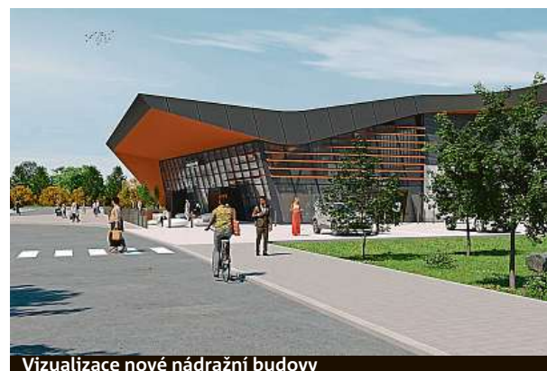
Vizualizace nové nádražní budovy