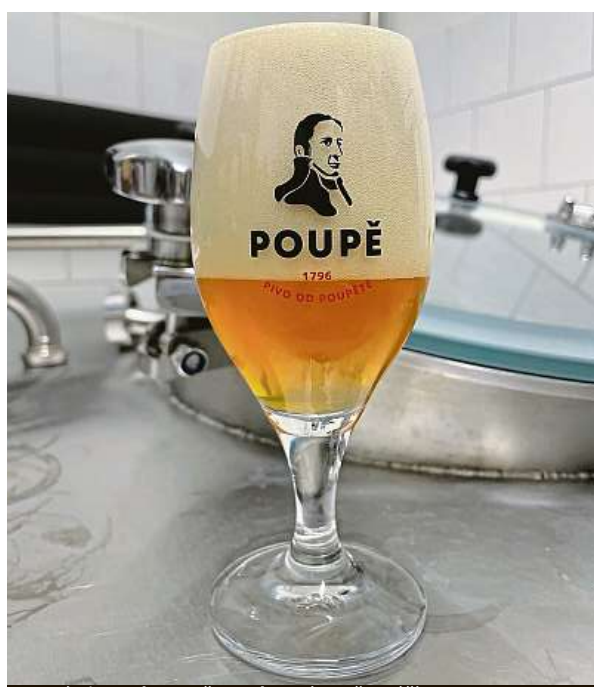
První pivo od Poupěte ochutnáte už v září.