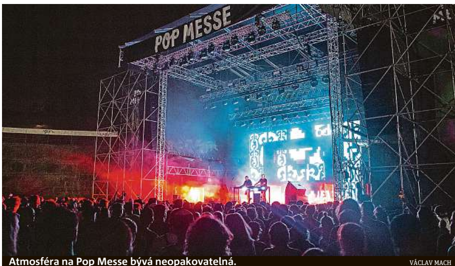
Atmosféra na Pop Messe bývá neopakovatelná.

Počínaje dneškem začínají vrcholit celoroční oslavy 200 let od narození „otce genetiky“ G. J. Mendela. A slavit se bude také hudbou. Dnes v kostele sv. Augustina zahraje Brno Contemporary Orchestra, zítra hostí bazilika Nanebevzetí Panny Marie na Starém Brně novodobou světovou premiéru barokní zádušní mše z augustiniánské hudební sbírky – Puschmannovo Requiem zahraje Musica figuralis. V pátek na stejném místě zazní Janáčkova Glagolská mše v podání Filharmonie Brno. Hvězdou pátečního programu pak bude bezpochyby americká kapela Kool & the Gang, která v rámci svého vystoupení na Mendelově náměstí určitě nevynechá ani jeden z největších světových hitů, legendární píseň Celebration, která krátce po svém vzniku v roce 1980 okupovala první místa v amerických i britských hitparádách, má své místo v Síni slávy Grammy a přes 250 milionů zhlédnutí na YouTube. V sobotu na stejném místě zazpívá mimo jiné Ewa Farna či Bára Poláková. Vstup na všechny akce je zdarma.