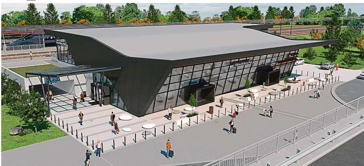
Nová nádražní budova v Králově Poli