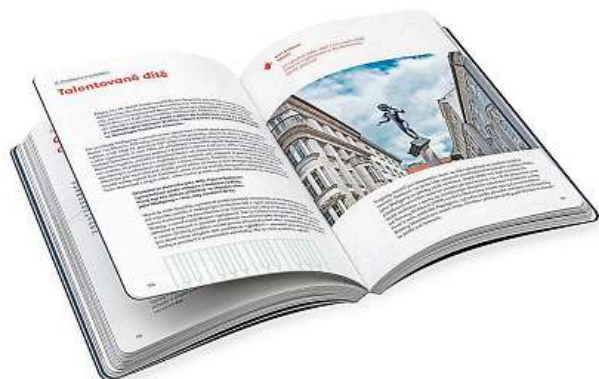
V knize se dočtete také o Wolfgangu Amadeu Mozartovi.