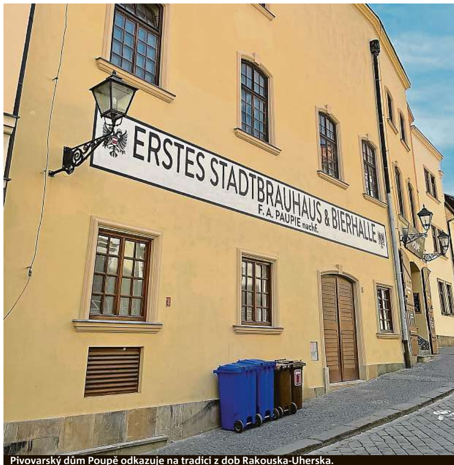
Pivovarský dům Poupě odkazuje na tradici z dob Rakouska-Uherska.