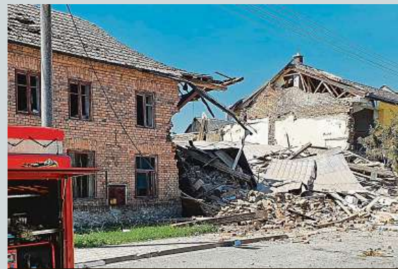
Hasiči odklízají následky výbuchu rodinného domu.