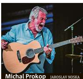
Michal Prokop

Rockový zpěvák a skladatel Michal Prokop už tradičně pořádá festival Krásný ztráty live na statku ve Všetvicích. Dvoudenní akce se letos koná v pátek 12. a v sobotu 13. srpna. Právě ve druhý zmíněný den bude Prokopovi 76. Velkou oslavu, jako loni na jubileum, však nechystá. Na koho z účinkujících se zkušený harcovník tentokrát těší? Také o tom hovořil Prokop pro deník Metro.