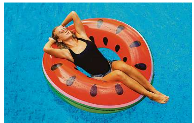
Stačí napustit a užít si letní pohodu.

Bazény Florida využívají trojvrstvou laminovanou fólii, vyztuženou polyesterovou tkaninou Polystrenght. Její kvalitní zpracování zajišťuje dlouhodobé bezproblémové užívání bazénu.