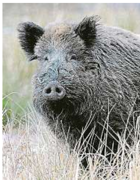
Divočák MČ PRAHA KLÁNOVICE

Tento fakt potvrdila i klánovická radnice. Její zástupci ale začátkem týdne přispěli s dalším prohlášením, že se v místním lese kaňouři nemnoží nekontrolovaně.