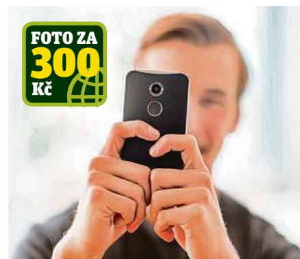
FOTO ZA 300 Kč

Společnost FAST Develop staví pod Nemocnicí Na Homolce rezidenční Homolka Hills. Hotovo bude na podzim roku 2024. Vedle parku Klamovka roste rezidenční bydlení Vilapark Klamovka.