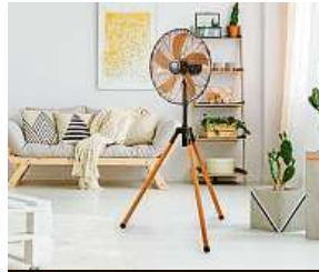
... nebo doma. 2 x MIRONET

Nárůst v prodeji zaznamenal také internetový obchod Mironet.cz u ventilátorů od výrobce DOMO. Belgická značka DOMO nabízí širo-