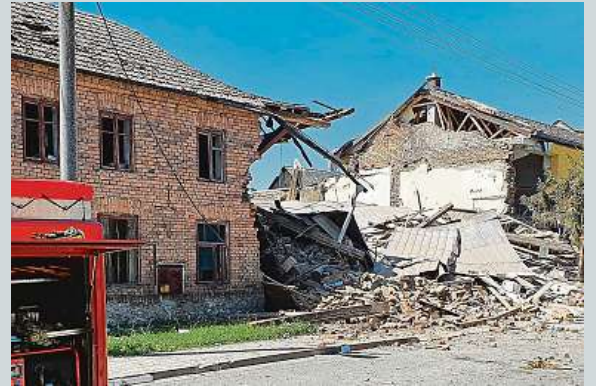
Hasiči odklízejí následky výbuchu rodinného domu.