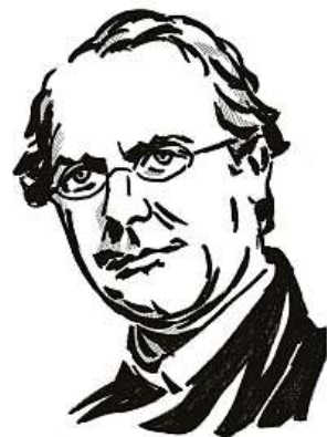
Pokusy s hráškem měly vliv.

Odkaz Gregora Johanna Mendela oslavuje brněnský festival.