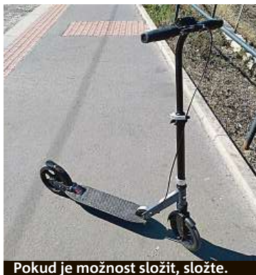
Pokud je možnost složit, složte.