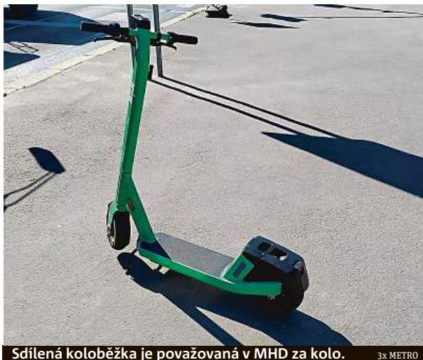
Sdílená koloběžka je považovaná v MHD za kolo.

Velikostní omezení pro koloběžky pochopitelně neplatí v cyklobusech. V autobusech s připojeným vlečným vozem pro přepravu jízdních kol a v autobusech se speciálními nosiči se koloběžky pro změnu přepravovat nemohou. „Je to z důvodu nemožnosti jejich řádného uchycení,“ vysvětluje Řehková.