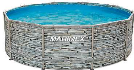
Bazén Marimex Florida seženete třeba v designu KAMEN.

Zprovoznění bazénu je opravdu jednoduché. Od jeho vybalení můžete do třiceti minut napouštět vodu. Stačí jen připravit místo na bazén, rozvinout bazénovou podložku, sestavit podpěrnou konstrukci a navléknout na ni bazénovou fólii.