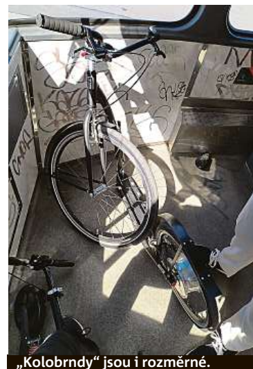
„Kolobrdy“ jsou i rozměrné.