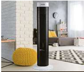
Osvěžení v kanceláři...

I proto hlásila minulý rok většina obchodů s elektrospotřebiči „vyprodáno“ u všech nabízených ventilátorů. Letos je situace se zásobami lepší, ale přesto je znát výrazně zvýšená poptávka.