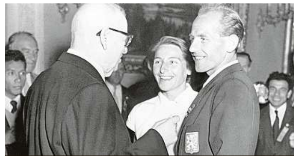
Manželé Zátopkovi u finského prezidenta

Za pouhé tři dny se pustil i do maratону, který nikdy předtím neabsolvoval. K překvapení všech ho suverénně vyhrál, opět v olympijském