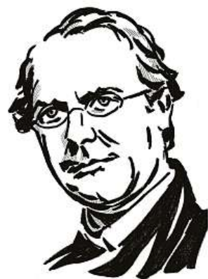
Pokusy s hráškem měly vliv.

Odkaz Gregora Johanna Mendela oslavuje brněnský festival.