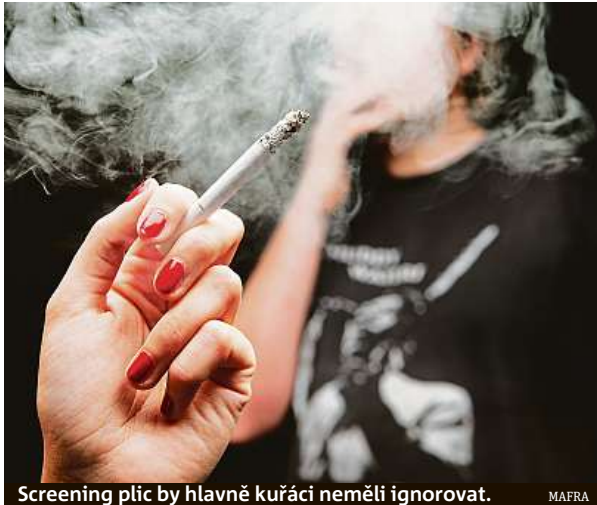
Screening plic by hlavně kuřáci neměli ignorovat.

Dokud jsem nešel k doktorovi, tak jsem byl zdravý! Tak tuto větu jste už určitě někdy v životě slyšeli. Možná vyšla také z vašich úst.