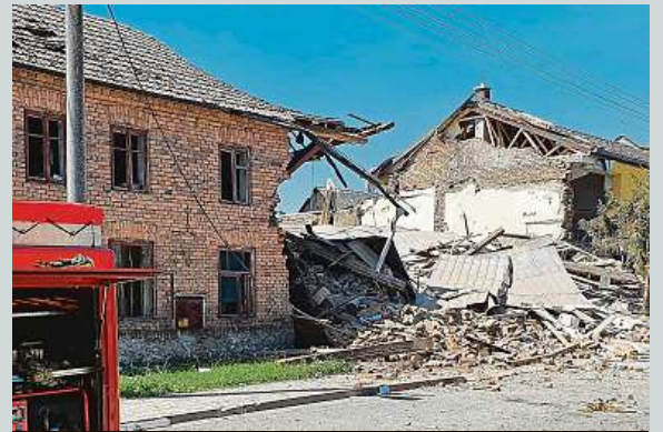
Hasiči odklízají následky výbuchu rodinného domu.