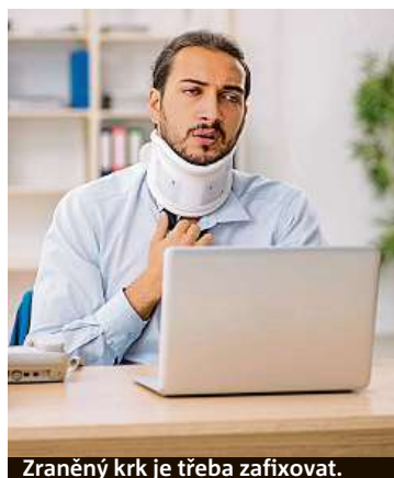
Zraněný krk je třeba zafixovat.