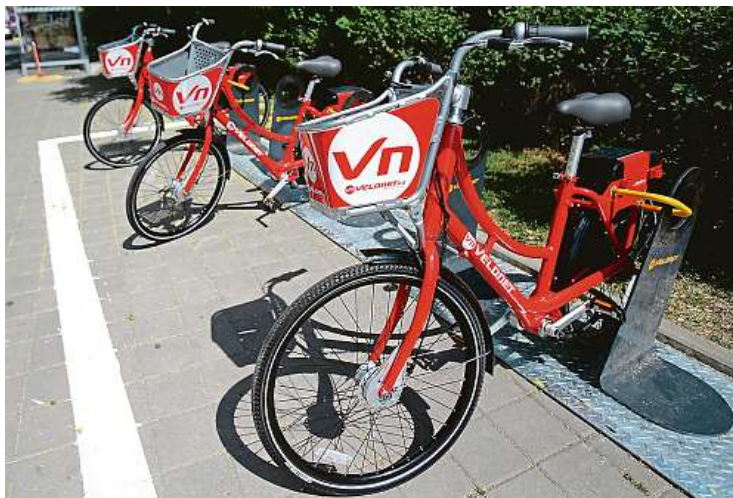
Bikesharingová firma Velonet již ukončila provoz svého systému.

V Praze se sdílí, co se jen dá. Kola, elektrické skútry i auta