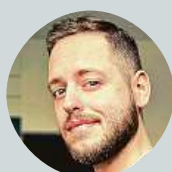
Jirka Denemark Přátelé, Chůva k pohledání, 2 Socky a Comeback.