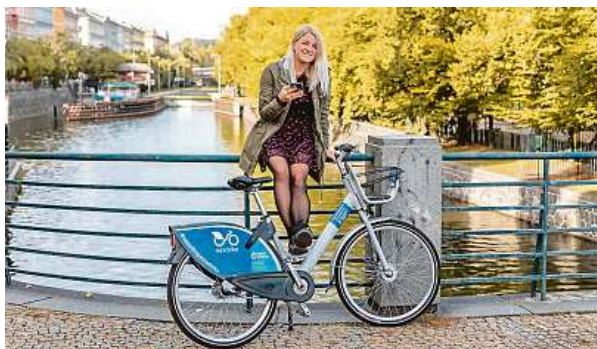
Kolo Nextbike si v Praze můžete půjčit už teď.

„Nextbike působí v Česku již ve 23 městech včetně Prahy. Podporu od města pak přímo využíváme v devatenácti z nich. Je otázkou, nakolik bude něco podobného dávat v Praze smysl,“ dodává pro Metro Karpov.