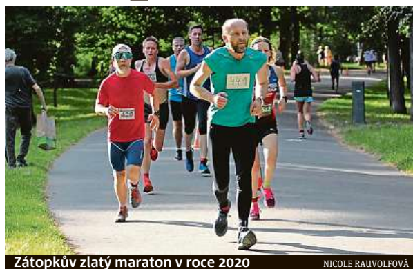
Zátopkův zlatý maraton v roce 2020

Akce začíná dnes na atletickém stadionu Spartaku v Pra-