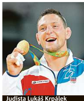
Judista Lukáš Krpálek