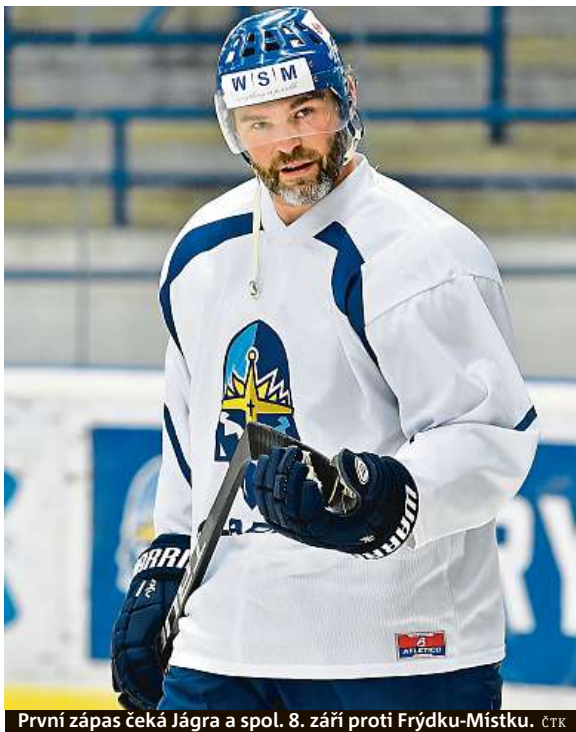
První zápas čeká Jágra a spol. 8. září proti Frýdku-Místku. ČTK

meniskem. Starty sbíral jen po vteřinách kvůli pravidlu, aby mohl případně naskočit do baráže o extraligu, což se nestalo. „Nic jsem ale od sebe neočekával. Nečekal jsem žádné zázraky, ale byl jsem rád, že jsem trénink přežil. Udělám pro to ale maximum, to mohu slíbit. A věřím, že se to bude den ode dne zlepšovat,“ řekl Jágr. „V mém věku když šest měsíců nic neděláte, je to, jako kdybyste někomu zlomili obě nohy a chtěli pak po něm, aby první den výborně chodil a šel si ještě zaběhat. Nijak neřukám, беру to, jak to je,“ doplnil olympijský vítěz z Nagana a dvojnásobný mistr světa. ČTK