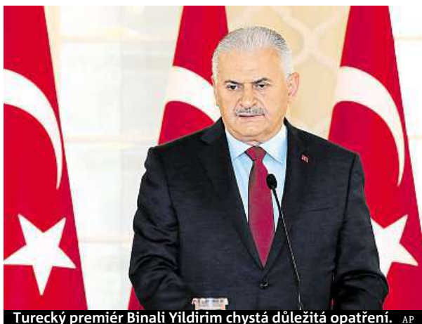
Turecký premiér Binali Yıldırım chystá důležitá opatření.

O trestu smrti se začalo uvažovat po pátečním zmařeném pokusu o vojenský puč. V zemi mezitím pokračují čistky státních institucí od údajných účastníků puče. Justice kvůli němu prověřuje 9322 osob. Funkce včera muselo opustit 257 zaměstnanců úřadu premiéra a 492 pracov-