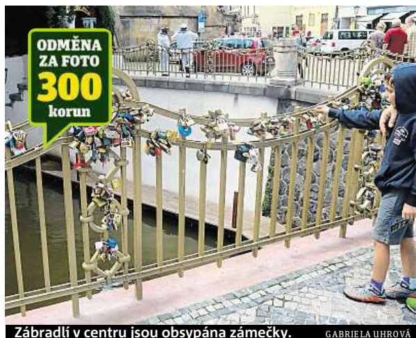
Zábradlí v centru jsou obsypána zámečky. GABRIELA UHROVÁ

Po několikahodinovém štípaní, řezání či broušení na mostě skončilo v kýblech