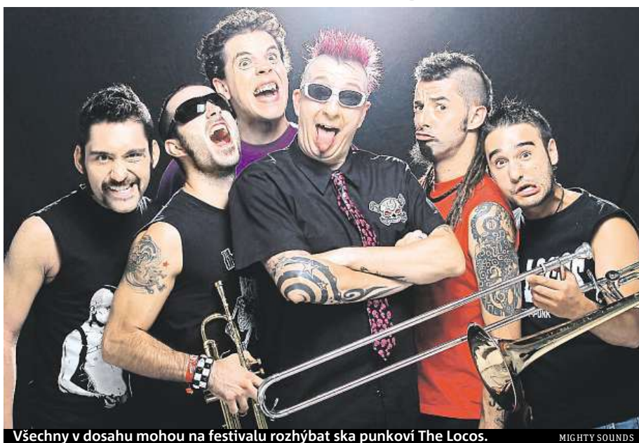
Všechny v dosahu mohou na festivalu rozhybat ska punková The Locos.

Hlavními hvězdami táborského hudebního festivalu Mighty Sounds budou drum