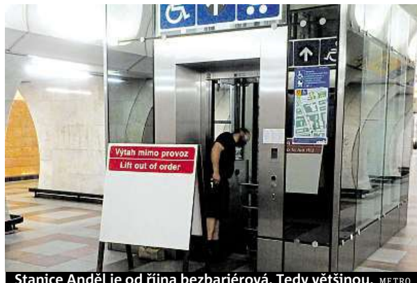
Stanice Anděl je od října bezbariérová. Tedy většinou. METRO

Není to poprvé, kdy šachtou tekla voda. Louže byly ve stanici už v únoru. „Průsaky jsou způsobeny špatnou prací při stavbě výtahové šachty,“ tvrdila už v únoru mluvčí dopravního podniku Aneta Řehková. Dopravní podnik výtah už v únoru reklamoval, s loužemi tehdy bojoval kbelíky, hadry a vytíráním. „Stanice Anděl je pod