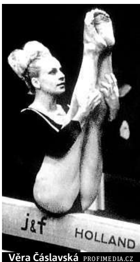
Věra Čáslavská

Dosud nejpočetnější ryze českou výpravu zatím viděla olympiáda v Aténách, kam v roce 2004 vyrazilo 142 soutěžících, pokud bychom ale brali v úvahu i účasti Československa a českých zemí jako součásti Rakouska-Uherska, přivítaly naši největší výpravu olympijské hry v Moskvě v roce 1980. Československo reprezentovalo v Sovětském svazu hned 211 sportovců, kteří přivezli dosud rekordních čtrnáct medailí (dvě zlaté, tři stříbrné a devět bronzových).