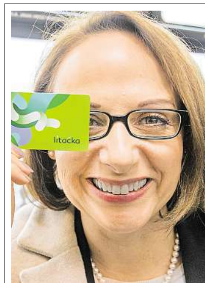
Lítačka a Opendcard

Od 1. března vydávají úředníci na přepážkách ve Škodově paláci novou pražskou tramvajenku pojmenovanou Lítačka.