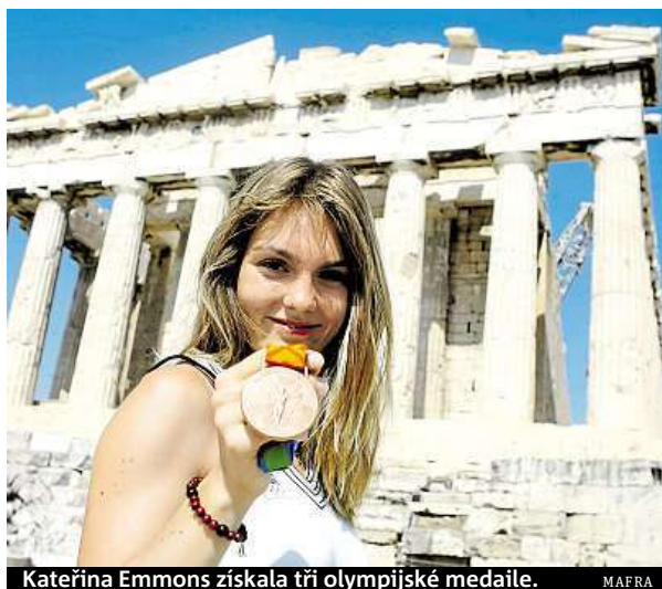
Kateřina Emmons získala tři olympijské medaile.

„Jakkoli bychom nechtěli snižovat úspěchy Českoslovanů na moskevské olympiádě, je na tomto místě potřeba dodat, že konkurence byla v roce 1980 výrazně limitována. Hned 65 států se her odmítlo zúčastnit, ať už kvůli bojkotu zdůvodněnému sovětskou invazí do Afghánistánu o rok dříve, nebo z ekonomických důvodů,“ říká Zuza-