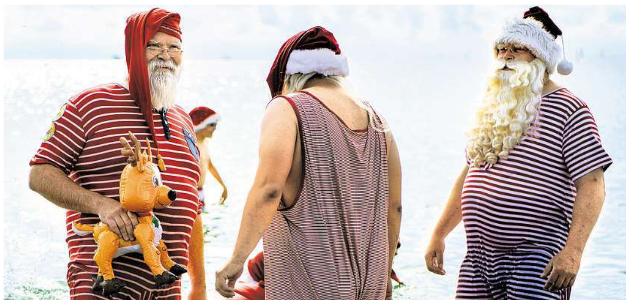
Mají kongres. Santa Clausové z celého světa si dali dostaveníčko na pláži poblíž dánské metropole Kodaně.

Koukání na displeje. Děti mají o prázdninách více volného času na své mobily a tablety, podle lékařů to však škodí jejich zraku. Prohlídky. Oči se mají kontrolovat pravidelně jako zuby, to se ale neděje STRANA 6