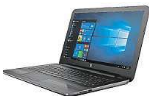
HP 250 G5 MIRONET

My jsme ho našli a řekneme vám, který notebook tato kritéria splňuje. Tím vyvoleným je multimediální notebook HP 250 G5. Ideální jednoduše velikost displeje pro všechny aktivity představuje úhlopříčka 15,6", již je právě HP 250 G5 osazen. Jeho anti-reflexní povrch zabraňuje nepříjemným odleskům a vy se tak vždy budete moci plně soustředit na to, co právě děláte. „Gé pětku“ můžete pořídit v rozmanitých konfiguracích, my se dnes zaměříme na tu s výkonným 2jádrovým procesorem Intel Core i5-6200U, taktovaným na 2,3 GHz, 4 GB operační paměti