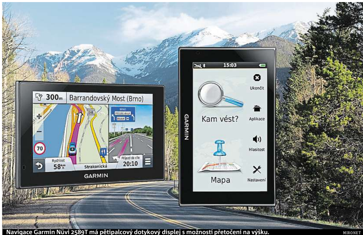
Navigace Garmin Nuvi 2589T má pětipalcový dotykový displej s možností přetočení na výšku.

Navigace vás dove- de do cíle ve 45 stá- tech Evropy.