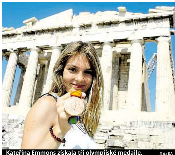
Kateřina Emmons získala tři olympijské medaile.

větskou invazí do Afghánistánu o rok dříve, nebo z ekonomických důvodů,” říká Zuzana Lhotáková z SAS Institute ČR, firmy, jež se podílela na analýze olympijských dat.