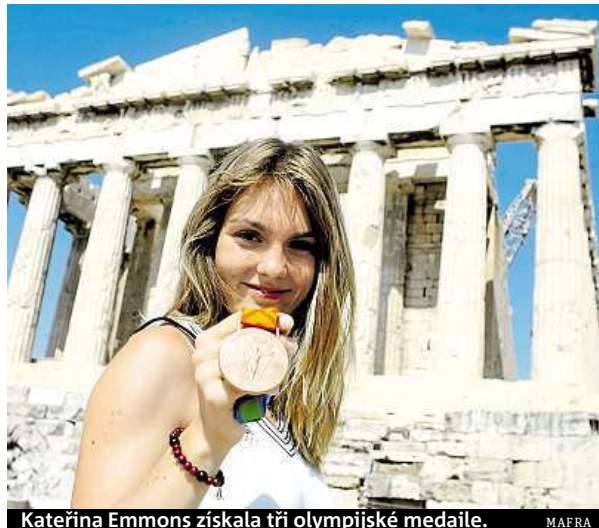
Kateřina Emmons získala tři olympijské medaile.

větskou invazí do Afghánistánu o rok dříve, nebo z ekonomických důvodů,” říká Zuzana Lhotáková z SAS Institute ČR, firmy, jež se podílela na analýze olympijských dat.