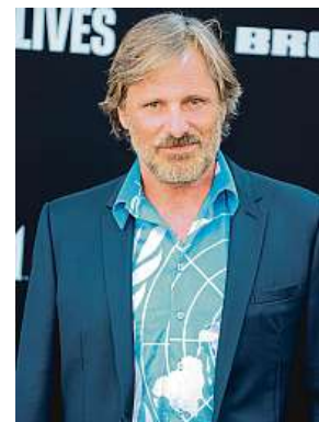
Viggo Mortensen letos oslaví 66. narozeniny.

Pořadatelé již dříve oznámili, že na zakončení festivalu převezme Ivan Trojan také Cenu prezidenta filmového festivalu. Herce tak k jeho letošním šedesátinám ocení za přínos tuzemské kinematografii. Významným hostem