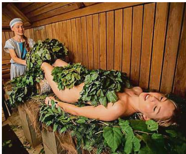
Při saunování v těle dochází ke spuštění termoregulačních dějů, které jsou důležité pro organismus. AQUAPALACE PRAHA

Už tento pátek proběhne v Aquapalace Praha Banya Fest. Jde o unikátní festival přírodního saunování, kromě soutěže Banya Master 2024 je připraven bohatý doprovodný program plný odpočinku a relaxace. Soutěž o mistra metličkových procedur bude probíhat ve speciální prosklené sauně. Po celou dobu festivalu si můžete dopřát bylinné a banya ceremoniály, luční masáže, objevit netradiční sauny a horké kádě, zúčastnit se přednášek a workshopů či meditací s mistry. Na místě můžete podstoupit aromaterapii nebo chladovou terapii a pochutnat si na jedinečné herbal i vegan gastronomii. Festival potrvá až do neděle. MET