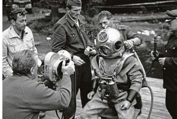
Československá televize natáčí potápěče, kteří ze dna Černého jezera vynášejí bedny, v nichž byly pozoruhodné dokumenty.

Neptun se roztočil přesně před šedesáti lety, v sobotu 20. června 1964. Scénář i pro-