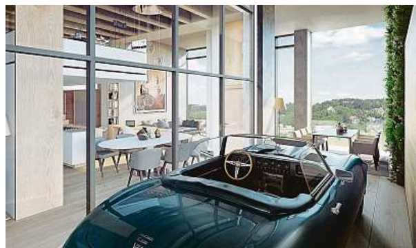
Slevu nedostanete, auto také ne. To vlastní můžete vyvézt výtahnem až do bytu. Lákadla k nákupu bytu mohou být všelijaká.