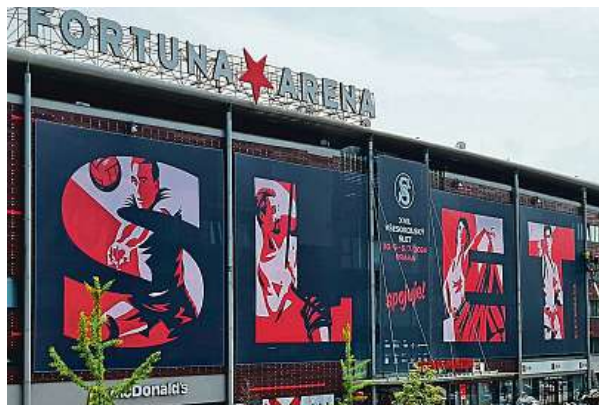
Fortuna Arena v Edenu už se mění do sletového hávu.

„Těšíme se na úžasnou atmosféru, která se opakuje jednou za šest let. Spojujeme radost, hrdost, lví silou, energií, nadšením i hudbou. Spolupráce s Lucií Bílou a Jiřím Kornem, kteří svým vystoupe-