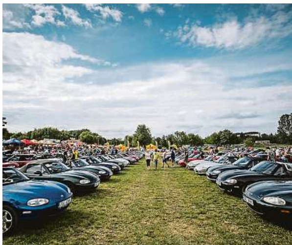
Od velkolepého srazu, který se konal rovněž o víkendu 21. až 23. června v Autokempu Rozkoš, uplynulo pět let.

Akce je určena převážně pro majitele vozů MX-5. Ti si budou moci od pátku do neděle vyzkoušet jízdu zručnosti, koordinované projíždky