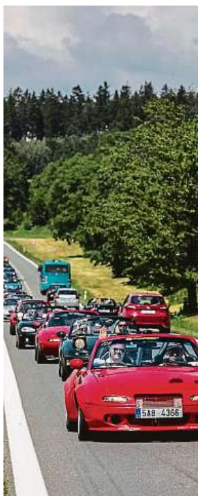
Víkendový výroční sraz vozů značky Mazda se blíží.