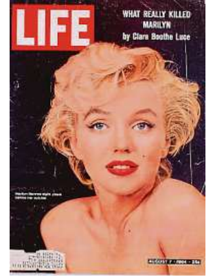
Obálka časopisu Life ze srpna 1964 s Marilyn Monroe

Ani Československá televize nezahálela. Promptně o „nálezu“ natočila dokument, který sklídl velký di-