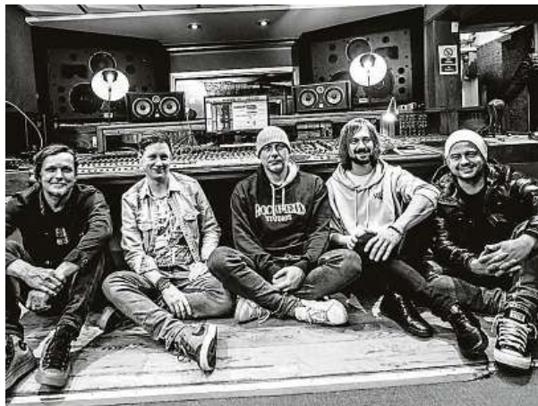
Chinaski letos slaví 30 let. Zvuk nové písně kapela opatřila během svého únorového pobytu ve světoznámém studiu Rockfield. CHINASKI

Všechny nově nahrané staré písně pohromadě se objeví na speciálním albu, které si budou moct fanoušci poprvé