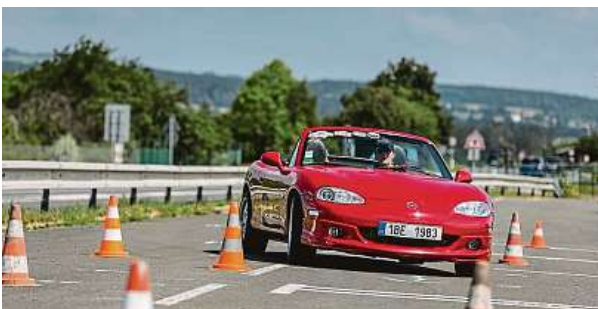
Jízdy zručnosti a koordinované projíždky patří k vrcholům mazdáckého srazu. Myslíte, že byste také nesrazili žádný kužel?