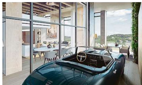
Slevu nedostanete, auto také ne. To vlastní můžete vyvézt výtahem až do bytu. Lákadla k nákupu bytu mohou být všelijaká.