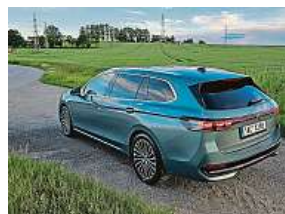
Křížník na cestách

vým turbodieselem se 110 kW a sedmistupňovým automatem je na tohle všechno výborná volba. Střed nabídky motorů, prostřední z dieselů, v katalogu jsou však ještě dva plug-in hybridy a jeden