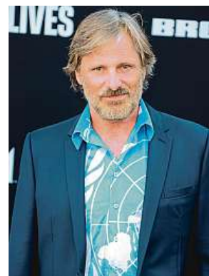
Viggo Mortensen letos oslaví 66. narozeniny.

Pořadatelé již dříve oznámili, že na zakončení festivalu převezme Ivan Trojan také Cenu prezidenta filmového festivalu. Herce tak k jeho letošním šedesátinám ocení za přínos tuzemské kinematografii. Významným hostem