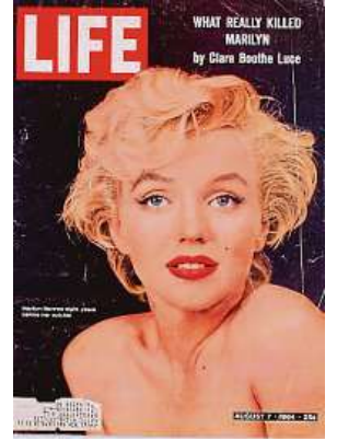
Obálka časopisu Life ze srpna 1964 s Marilyn Monroe

Ani Československá televize nezahálela. Promptně o „nálezu“ natočila dokument, který sklídl velký di-