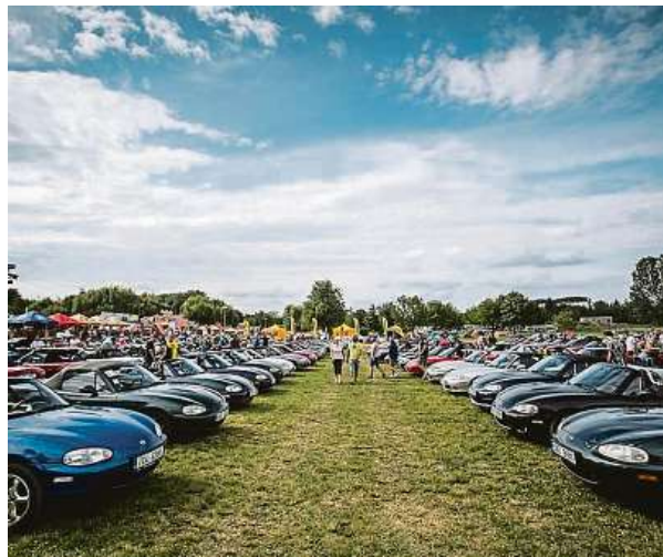
Od velkolepého srazu, který se konal rovněž o víkendu 21. až 23. června v Autokempu Rozkoš, uplynulo pět let.

Akce je určena převážně pro majitele vozů MX-5. Ti si budou moci od pátku do neděle vyzkoušet jízdu zručnosti, koordinované projíždky