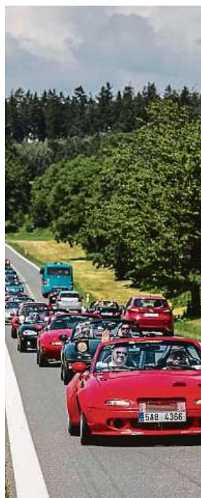
Víkendový výroční sraz vozů značky Mazda se blíží.