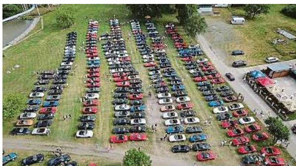
Účastníci akce si odvezou dárkové předměty a zúčastní se zápisu do České knihy rekordů. Přijet se může podívat každý, kdo má rád auta.

Asi tolik tisíc vozů Mazda MX-5 jezdí na českých silnicích. MET