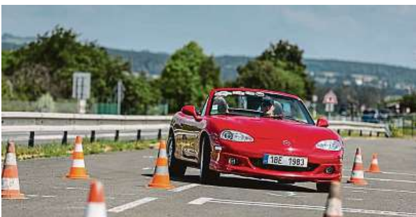
Jízdy zručnosti a koordinované projíždky patří k vrcholům mazdáckého srazu. Myslíte, že byste také nesrazili žádný kužel?