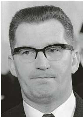
Lubomír Štrougal, v letech 1970 až 1988 premiér ČSSR

Doba se ale změnila, v 60. letech již tály ledy, ke vstupu k choulostivé hranici stačilo razítko od ministerstva vnitra. Toho využili reportéři Československé televize, kteří svůj investigativní pořad Zvědavá kamera zavedli v dubnu 1964 právě k Černému jezeru. Kolem něj se odpradávná točily fantastické povídky, jeho záračná voda prý měla kdysi „zakonzervovat“ kompletní svatební průvod i s jakousi prokletou hraběnkou uvězněnou v kočáře. Reporté-