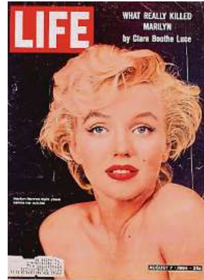
Obálka časopisu Life ze srpna 1964 s Marilyn Monroe

Ani Československá televize nezahálela. Promptně o „nálezu“ natočila dokument, který sklídl velký di-