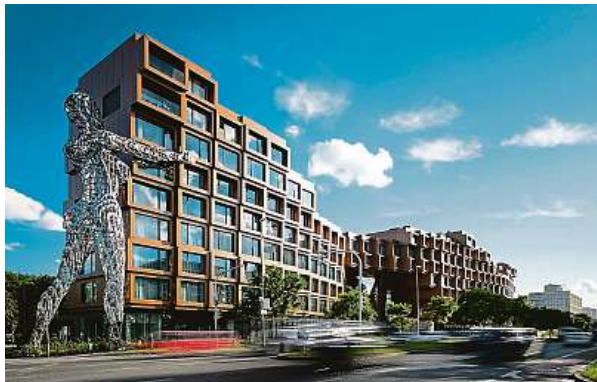
„Bonusem“ k novému bytu může být třeba neobvyklé umělecké dílo, které může zvýšit cenu bytu při pozdějším prodeji. TRIGEMA

Doba vhodná k pořízení nového bytu už byla, nebo se ještě vyplatí počkat? Inflace požrala kdeco, současně však přinutila firmy i stát přece jenom zvýšit zaměstnancům platy a ti i na vyšší úrokové sazby hypoték zase mají. De-