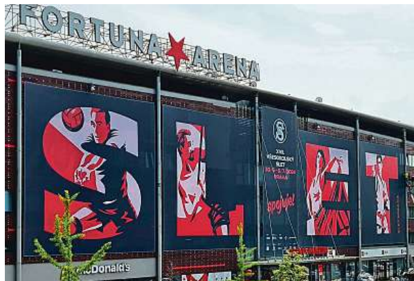
Fortuna Arena v Edenu už se mění do sletového hávu.

„Těšíme se na úžasnou atmosféru, která se opakuje jednou za šest let. Spojujeme radost, hrdost, lví silou, energií, nadšením i hudbou. Spolupráce s Lucií Bílou a Jiřím Kornem, kteří svým vystoupe-