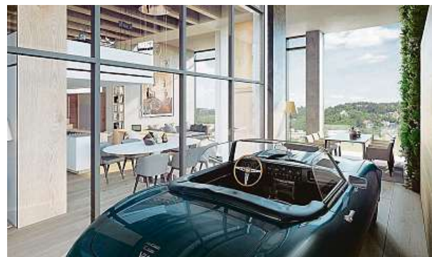
Slevu nedostanete, auto také ne. To vlastní můžete vyvézt výtahem až do bytu. Lákadla k nákupu bytu mohou být všelijaká.