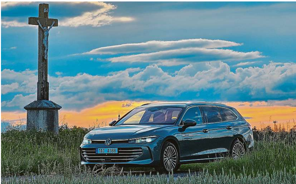
Úžasné jsou v noci nové světlomety IQ.Light. Od výbavy Elegance jsou v základu. Umí díky mnoha diodám parádně vykrývat okolní provoz.