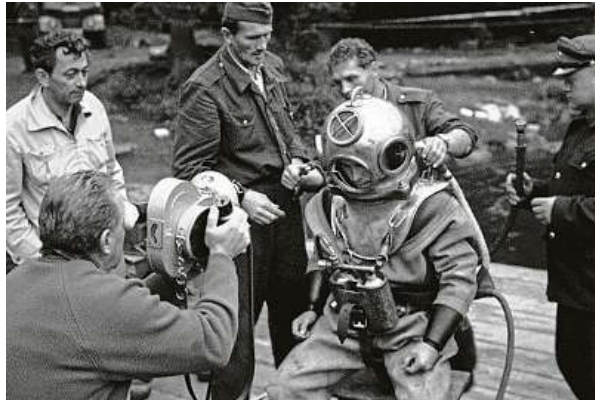
Československá televize natáčí potápěče, kteří ze dna Černého jezera vynášejí bedny, v nichž byly pozoruhodné dokumenty.

Neptun se roztočil přesně před šedesáti lety, v sobotu 20. června 1964. Scénář i pro-