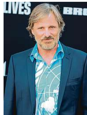
Viggo Mortensen letos oslaví 66. narozeniny.

Pořadatelé již dříve oznámili, že na zakončení festivalu převezme Ivan Trojan také Cenu prezidenta filmového festivalu. Herce tak k jeho letošním šedesátinám ocení za přínos tuzemské kinematografii. Významným hostem