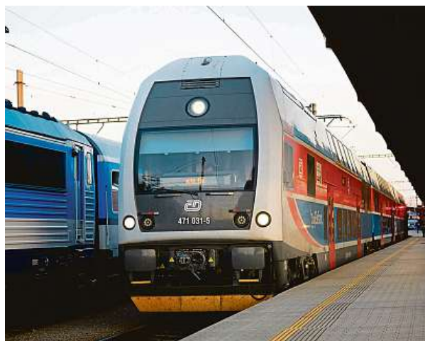
Trasu mezi Kolínem a Masarykovým nádražím standardně obsluhují elektrické vlaky CityElefant.