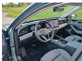
Infotainment udělal obří skok.

S tím autem se dá dělat všechno. Jet večer do divadla, vzít rodinu k moři. Stěhovat rozvedeného kamaráda. Nebo v něm přespat na matraci, když se vám nechce na Lužnici stavět stan. Dvě z těchto čtyř věcí jsme vyzkoušeli. Naštěstí jen to divadlo a vodu. Passat Elegance s dvoulitro-