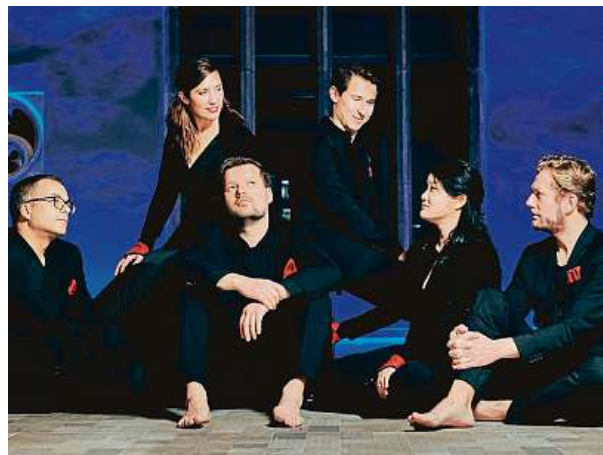
Ensemble Polyharmonique se při zahajovacím festivalovém koncertě 18. července v Praze představí vůbec poprvé.