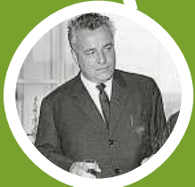
České filmy připomenou díla scenáristy Jana Procházky.