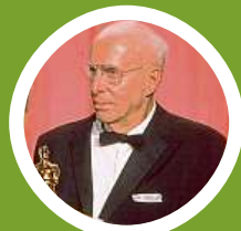
Retrospektiva připomene Howarda Hawke.