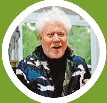
Promítnou současné filmy Pedra Almodóvara.