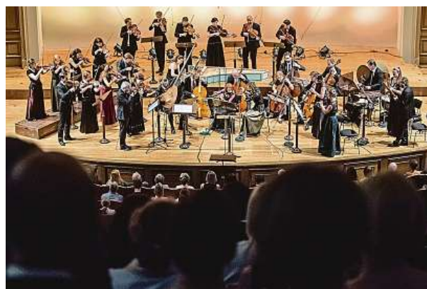
Při slavnostním zakončení slavností se 8. srpna představí také „domácí“ soubor Collegium Marianum. MARTIN DIVÍŠEK