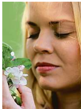
Příjem tekutin je velmi důležitý u těhotných žen.

Během puberty je pro dívky důležitý správný pitný režim, neměly by to přehánět se slazenými, energetickými nápoji, kofeinem či alkoholem. „V tomto věku se doporučuje okolo 50 ml tekutin na 1 kg tělesné hmotnosti a den,“ uvádí Věra Boháčová, nutriční terapeutka se zaměřením na prevenci a léčbu civilizačních onemocnění u dospělých i dětí. „Základem by měly být slabě a středně mi-