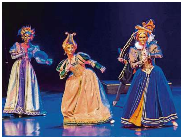
Představení polského souboru Cracovia Danza Ballet nechá diváky nahlédnout do prostředí šlechtických zábav. ILJA VAN DE PAVERT

Festival 18. července zahájí německý vokální soubor Ensemble Polyharmonique, který se v Praze představí vůbec poprvé. Vokálně-instrumentální program s atraktivní dramaturgií bude prostřednictvím duchovních koncertů, motet a madrigalů konfrontovat italské vzory a je-