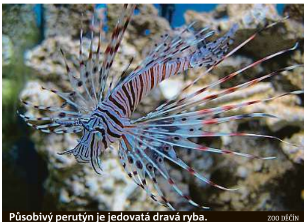
Působivý perutýn je jedovatá dravá ryba. ZOO DĚČÍN

Jakmile se všežraví perutýni dostanou do systému korálových útesů, během pěti týdnů sežerou 79 procent mladých mořských živočichů. Ve většině oblastí, kde se v současnosti vyskytují, ne-