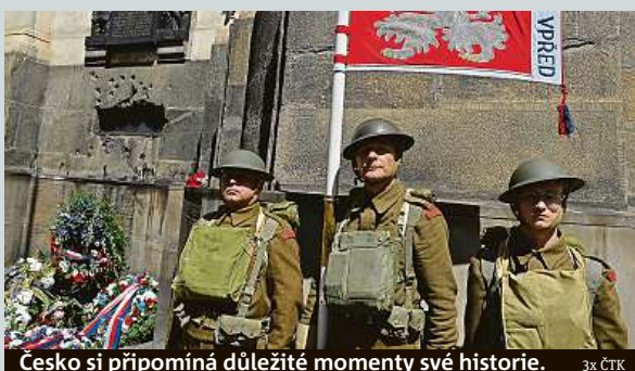
Česko si připomíná důležité momenty své historie.

kterí v těchto místech po atentátu na říšského protektora Reinharda Heydricha před 80 lety zemřeli po boji s nacistickou přesilou. Ve stejný den si oběti nacistického běsnění připomínali návštěvníci pietní akce v místech, kde stávala obec Ležáky. V sobotu