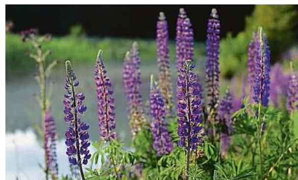
Lupina v CHKO Slavkovský les