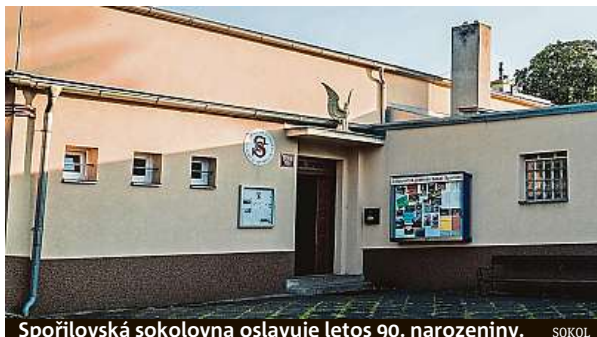
Spořilovská sokolovna oslavuje letos 90. narozeniny.

V mnohých pak budou mít návštěvníci možnost také přespát. Každý rok má Noc sokoloven své jednotící téma, o kterém se dozvíte v každé sokolovně. V letošním roce si nepřipomínáme jen 160 let od založení Sokola. Také si připomeneme 160 let od názvosloví, které zavedl jeden ze zakladatelů Sokola, dr. Miroslav Tyrš. Bez něj by sokolové nemohli správně cvičit. Názvosloví navíc jen s drobnými obměnami existuje dodnes. Schválně, víte, co znamená „upažit“, „předpažit“, „zanožit“ či „rozpor“? To a mnohem více přijďte zjistit už 24. června do nejbližší sokolovny. MET