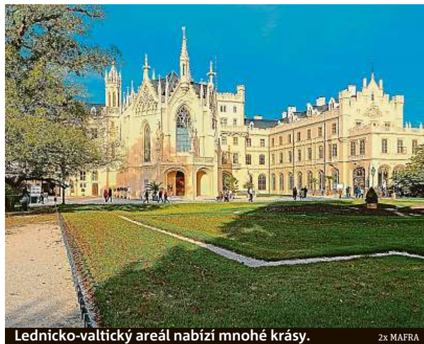
Lednicko-valtický areál nabízí mnohé krásy.

Do Krkonoš nemusíte jezdit jen na zimní lyžovačku. I v létě dokáží nabídnout spoustu báječného vyžití pro všechny generace. Jedete s dětmi? Pak je pro vás jako dělaný Wellness Hotel Svornost v Harrachově, který dokonce připravil pro malé děti aktivitu s názvem Putování s příšerkami. Díky úkolům a jejich plnění strávíte spoustu času v přírodě.