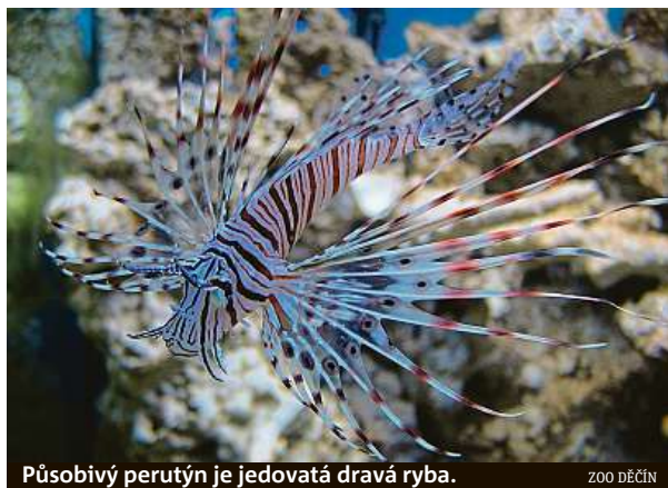
Působivý perutýn je jedovatá dravá ryba. ZOO DĚČÍN

Jakmile se všežraví perutýni dostanou do systému korálových útesů, během pěti týdnů sežerou 79 procent mladých mořských živočichů. Ve většině oblastí, kde se v současnosti vyskytují, ne-