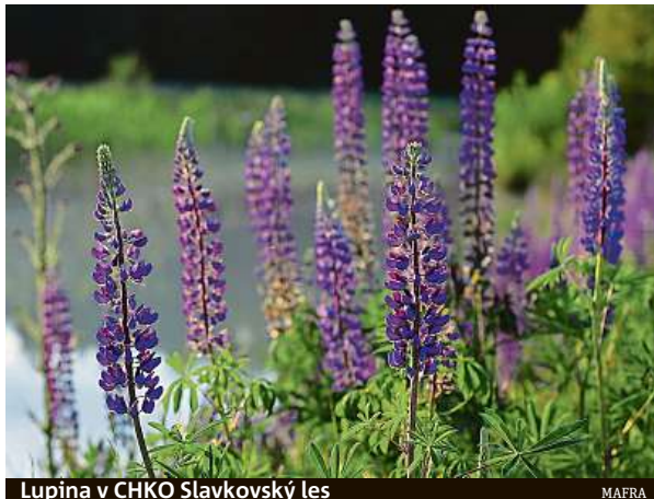
Lupina v CHKO Slavkovský les

„Lupina se bohužel vyskytuje i na krkonošských lou-