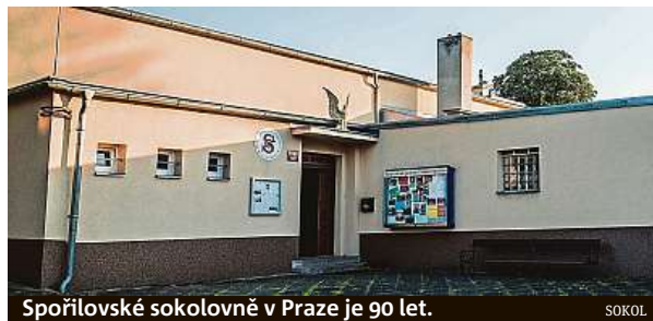
Spořilovské sokolovně v Praze je 90 let.

V mnohých budou mít lidé možnost přespát. Každý rok má Noc sokoloven jednotící téma, o kterém se dozvíte v každé sokolovně. V letošním roce si nepřipomínáme jen 160 let od založení Sokola. Také si připomeneme 160 let od názvosloví, které zavedl jeden ze zakladatelů Sokola, dr. Miroslav Tyrš. Názvosloví jen s drobnými obměnami existuje dodnes. Schválně, víte, co znamená „upažit“, „předpažit“, „zanožit“ či „rozpor“? To a také mnohem více přijďte zjistit už 24. června do nejbližší sokolovny. MET