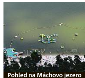
Pohled na Máchovo jezero