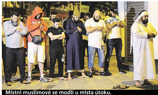
Místní muslimové se modlí u místa útoku.

Londýnská policie vyšetřuje noční útok na věřící jako teroristický čin.