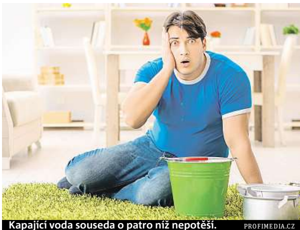
Kapající voda souseda o patro níž nepotěší.

Pojištění domácnosti se vztahuje na stavební součásti objektu – okna, dveře, malbu, podlahy i střechu. Kdežto pojištění domácnosti se sjednává pro obsah bytů, tedy vybavení domácnosti. Možnosti jsou různé. „Ti, kteří nemají sjednané pojištění domácnosti, mohou díky tzv. pojištění opuštěné domácnosti, které se sjednává jako připojištění k cestovnímu pojištění, získat komplexní ochranu vyba-