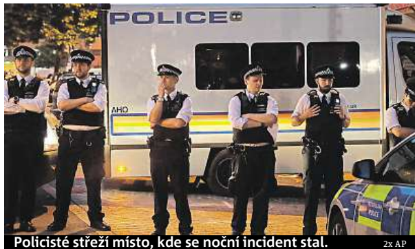
Policisté střeží místo, kde se noční incident stal.