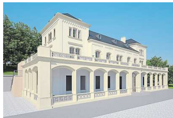
Vizualizace budovy po právě zahájené rekonstrukci