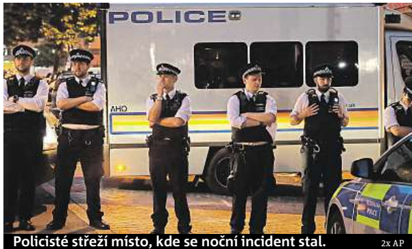
Policisté střeží místo, kde se noční incident stal.