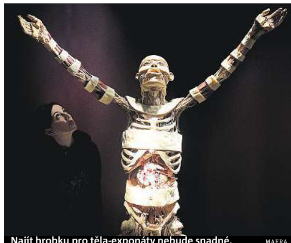
Najít hrobku pro těla-exponáty nebude snadné.

Podle něj je nejprve nutné vyřešit, jestli dali zemřelí souhlas s plastinací, což by měli řešit právníci. Podle starosty Prahy 7 Jana Čížinského žádné písemné souhlasy neexistují. „Zatím nám podobný dokument nikdo nepředložil,“ dodává. Čížinský už kontaktoval čínské vyslanectví, to se ale k ostatkům nehlásí. Prá-