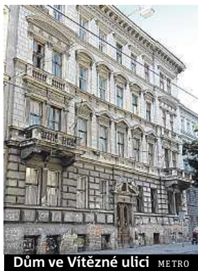
Dům ve Vítězné ulici METRO

Domy jsou prázdné z různých důvodů. „U starších objektů jsou to hlavně nevyjasněné majetkové nebo právní vztahy, koupě objektu za účelem pozdějšího prodeje nebo