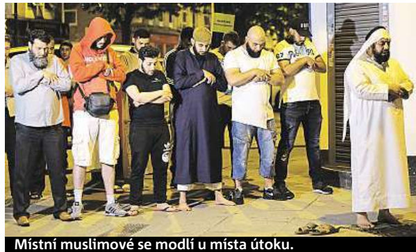
Místní muslimové se modlí u místa útoku.

Londýnská policie vyšetřuje noční útok na věřící jako teroristický čin.