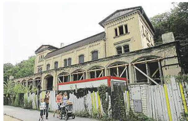
Šlechtovka z roku 2006. Zatím chátrá dál.