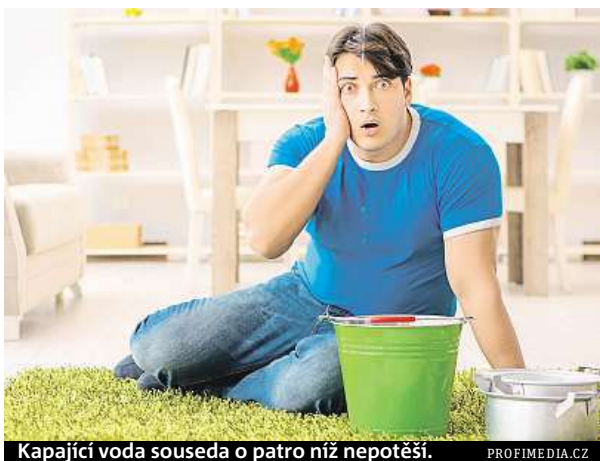
Kapající voda souseda o patro níž nepotěší.

Pojištění nemovitosti se vztahuje na stavební součásti objektu – okna, dveře, malbu, podlahy i střechu. Kdežto pojištění domácnosti se sjednává pro obsah bytů, tedy vybavení domácnosti. Možnosti jsou různé. „Ti, kteří nemají sjednané pojištění domácnosti, mohou díky tzv. pojištění opuštěné domácnosti, které se sjednává jako připojištění k cestovnímu pojištění, získat komplexní ochranu vyba-