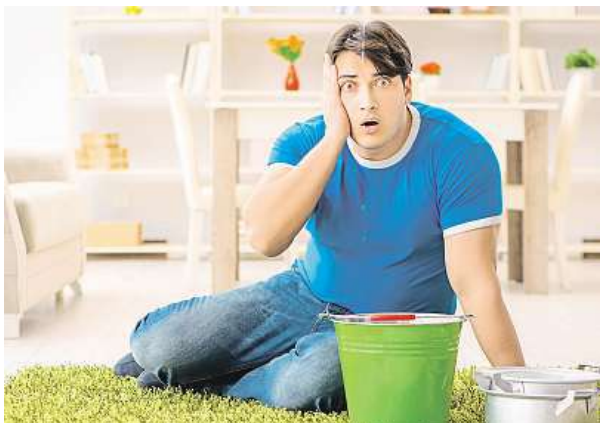
Kapající voda souseda o patro níž nepotěší.

Pojištění nemovitosti se vztahuje na stavební součásti objektu – okna, dveře, malbu, podlahy i střechu. Kdežto pojištění domácnosti se sjednává pro obsah bytů, tedy vybavení domácnosti. Možnosti jsou různé. „Ti, kteří nemají sjednané pojištění domácnosti, mohou díky tzv. pojištění opuštěné domácnosti, které se sjednává jako připojištění k cestovnímu pojištění, získat komplexní ochranu vyba-