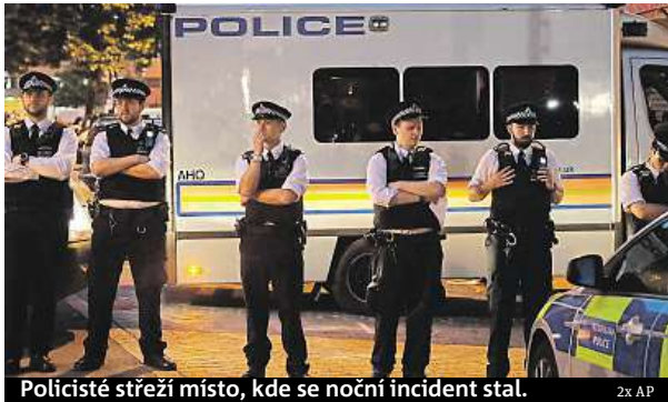
Policisté střeží místo, kde se noční incident stal.