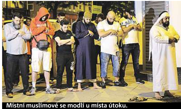
Místní muslimové se modlí u místa útoku.

Londýnská policie vyšetřuje noční útok na věřící jako teroristický čin.