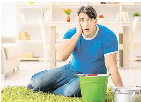
Kapající voda souseda o patro níž nepotěší.

Pojištění nemovitosti se vztahuje na stavební součásti objektu – okna, dveře, malbu, podlahy i střechu. Kdežto pojištění domácnosti se sjednává pro obsah bytů, tedy vybavení domácnosti. Možnosti jsou různé. „Ti, kteří nemají sjednané pojištění domácnosti, mohou díky tzv. pojištění opuštěné domácnosti, které se sjednává jako připojištění k cestovnímu pojištění, získat komplexní ochranu vyba-