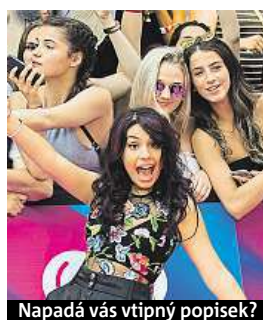
Napadá vás vtipný popisek?

Napište bublinu a reagujte na sloupek na: www.facebook.com/denikmetro