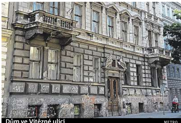
Dům ve Vítězné ulici

Bytový dům ve Vítězné ulici už roky chátrá. Prázdnou bytovku v centru vlastní zahraniční majitel, společnost Leonardo, s. r. o. „Podobné společnosti se v prostoru a času rozpínají do neprůhledného a nekonečného pavouka navzájem propojených firem, kdy jedna firma vlastní části dalších firem. To, co mají ale firmy jako Leonardo společné, je, že skuteční vlastníci zůstávají skryti ve spletnosti kdesi v daňových rájích – Nizozemsko, Kypr, Lucemburk nebo Panama, jako u tohoto domu,“ píše se na Facebooku Prázdné Domy. Tento