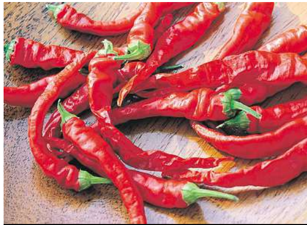
Chilli papričky jsou dobré také pro vaše zdraví.

„Pokud netrpíte nějakou chorobou (například srdeční vady nebo potíže s dechem), pak je chilli pouze nepříjemné, ale neublíží,“ vysvětluje