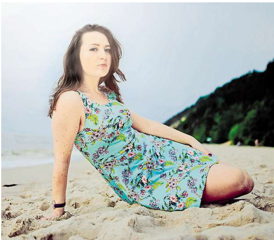
Jak tomu předejít? Vyhýbejte se i upnutému oblečení z umělých materiálů.

Nejčastější příčinou vaginální mykózy je kvasinka Candida albicans . Její přemnožení doprovázejí typické příznaky: urputné svědění, pocit pálení,