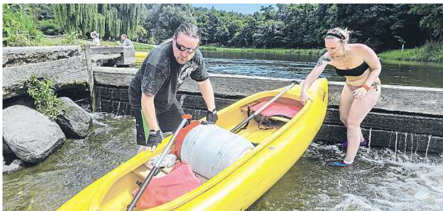
Málo vody. Vodáci museli přetahovat své lodě loni v červenci u Týnce nad Sázavou.

okolí je ale podle Jančara letos v dobré kondici. Ze ale řekou na většině jiných místech protéká vody nedostatek, přitom podle Jančara pozná každý laik. Kameny, které jsou normálně ponořené na úroveň hladiny, teď výhrůžně vyčnívají ven. „Jasně že se dá Vltava sjet i tak, ale když jedete třeba Zlatá Koruna – Boršov, není to nic pro nepozorné vodáky,“ dodává Jančar.