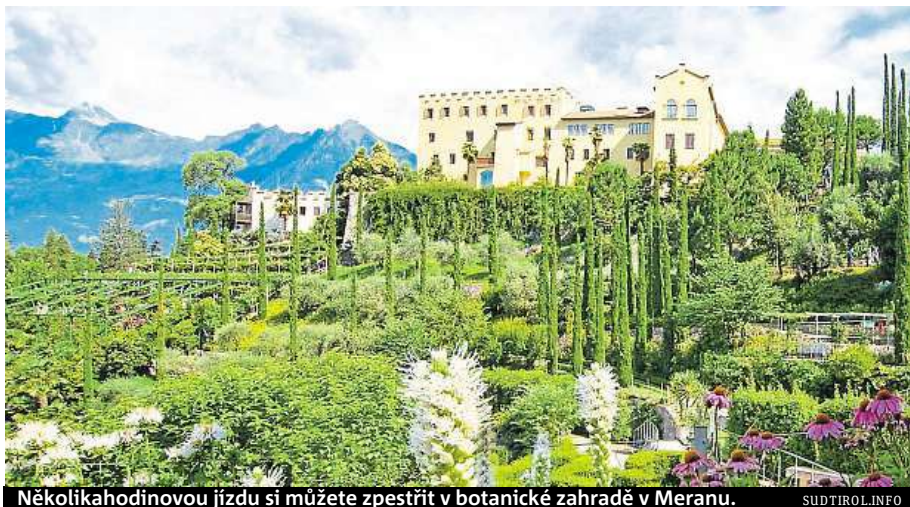
Několikahodinovou jízdu si můžete zpestřit v botanické zahradě v Meranu.

Přímo pod supermoderním lyžařským areálem Kronplatz leží městečko Bruneck, které tu stálo už ve 13. století. V útulných kavárnách a restauracích malebných ulic Brunecku pulzuje život. Na hradě Schloss Bruneck nad