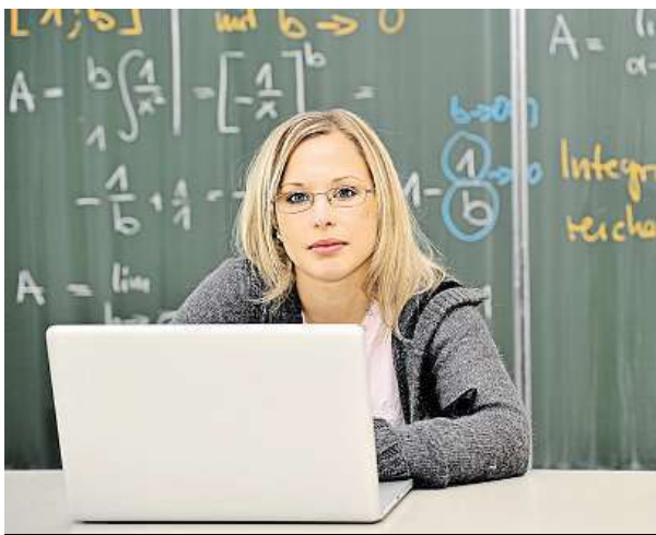
Oběťmi šikany bylo více než 20 procent učitelů.

Kybernetické útoky na učitele se nejčastěji odehrávají na sociálních sítích, mobilech nebo e-mailech. „Mezi