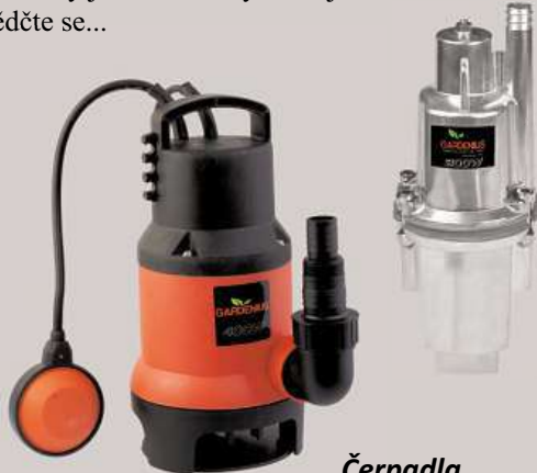
Čerpadla od 799 Kč