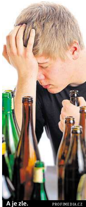
A je zle.

„Výsledky našich šetření také ukazují, že se podíl počtu jedinců v jednotlivých věkových kohortách z hlediska užívání marihuany zvyšuje. A můžeme si klást otázku, jak se studenti k alkoholu, cigaretám, marihuaně vlastně dostanou,“ upozorňuje Dolejš. Ač-