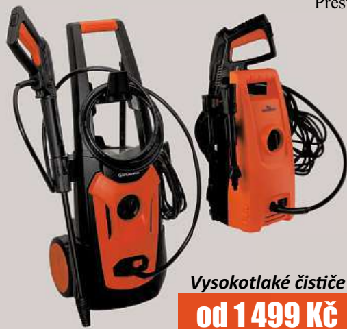
Vysokotlaké čističe od 1 499 Kč