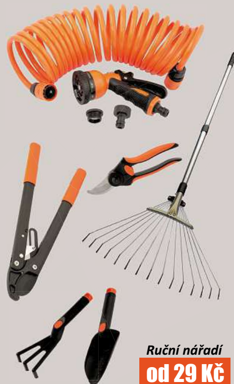
Ruční nářadí od 29 Kč