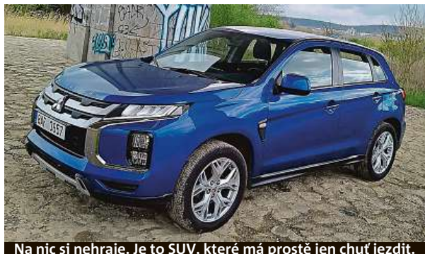
Na nic si nehraje. Je to SUV, které má prostě jen chuť jezdit.

Pohled do ceníku není taková tragédie: auto s příjemným ostrým designem přijde v nejlépejší specifikaci na 450 ti-