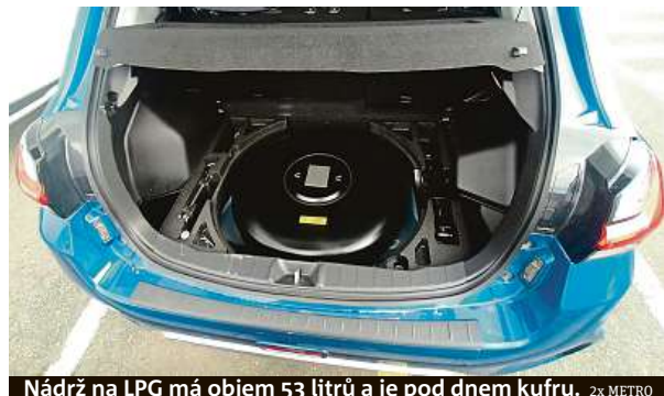
Nádrž na LPG má objem 53 litrů a je pod dnem kufru. 2x METRO

Nízká cenovka se promítá v interiéru. Model jako takový je na trhu už přes deset let, nedávno prošel jistou modernizací, ale uvnitř by to chtělo trochu přidat. Je to prostě starší škola, která však může na-