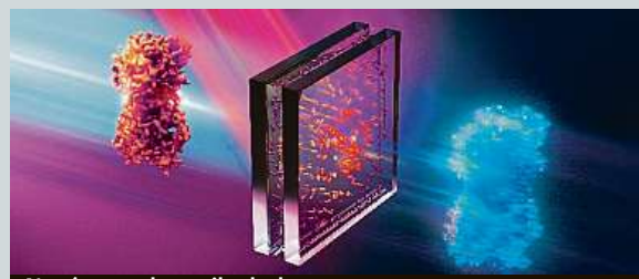
Nová metoda vzniku hologramu

Největšími favority hokejového MS, které začne v pátek v lotyšské Rize, jsou podle bookmakerů Rusko (4:1 – 4,45:1) a Kanada (4,5:1 – 4,7:1). Asi tři pětiny sázkařů věří českému týmu, který by měl podle kurzů skončit na čtvrtém místě. Sázkové kanceláře očekávají překonání předloňského hokejového rekordu přijatých sázek z MS na Slovensku za 1,8 miliardy korun. ČTK