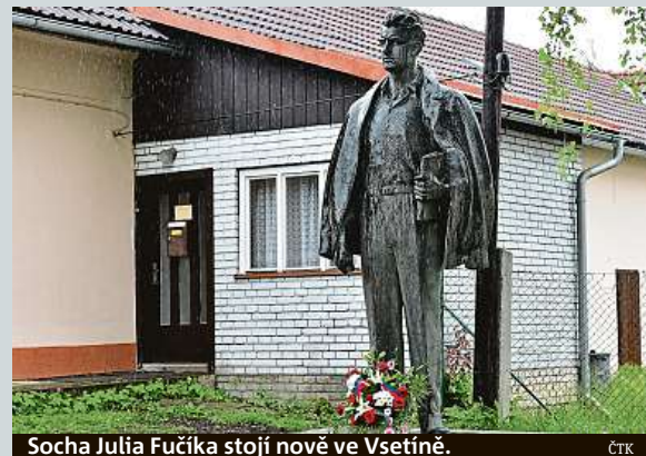
Socha Julia Fučíka stojí nově ve Vsetíně.