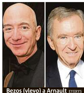
Bezos (vlevo) a Arnault EYERYS

Jméni obchodníka Bernarda Arnaulta se oproti tomu v letošním roce zvýšilo o 47 miliard, na 161,2 miliard