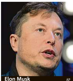
Elon Musk

Elon Musk už není ani druhým nejbohatším člověkem na světě, vystřídal jej Francouz Bernard Arnault. Prvenství si drží Jeff Bezos z Amazonu.