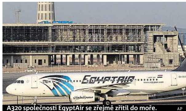
A320 společnosti EgyptAir se zřejmě zřítil do moře.

Letoun A320 společnosti EgyptAir s 66 lidmi včetně tří dětí na palubě se včera v půl čtvrté ráno ztratil z radarů. Posádka egyptského průzkumného letadla o několik hodin později, asi 200 kilometrů jihovýchodně od Kréty objevila dva předměty a dvě záchrané vesty, které podle Řeků byly z egyptského letounu. Jasně důkazy o zřícení letadla do Středozemního moře to ale nebyly. Na místo byly vyslány pátrací lodě. Příčina možného pádu letadla v době uzávěrky tohoto vydání nebyla známa. Podle české diplomacie mezi cestujícími nebyli žádní Češi. Dispečeri vypověděli, že mluvili s pilotem, když byl letoun nad ostrovem