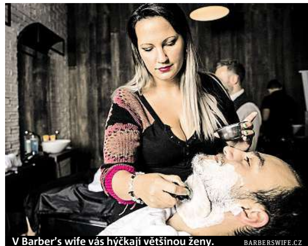
V Barber's wife vás hýčkají většinou ženy. BARBERSWIFE.CZ

V holičství vám nejen zastříhnou vousy, vlasy, ale také vás do hladka oholí břitvou. „Už jsem měl v křesle studenta i feditele. Mám pravidelné zákazníky, ale i ty, kteří sem přijdou zažít něco