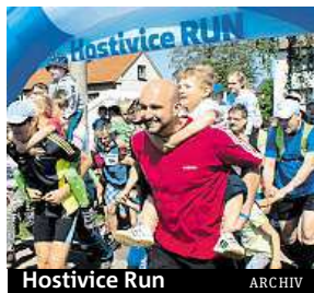
Hostivice Run

Závod se skládá z Hostivického půlmaratonu (21,1 km), Hostivické desítky (10 km) a Hostivické pětky (5 km). Posledním druhem závodu je Rodičovský ultraběh, ve kterém předvedou běžeckou vytrvalost rodiče se svými ratolestmi. Je dlouhý 750 metrů a toto číslo letos není náhodné. Městská část Litovice slaví