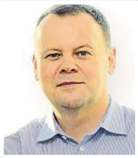
Jaké hlavní změny se odehrály na reklamním trhu za uplynulý rok