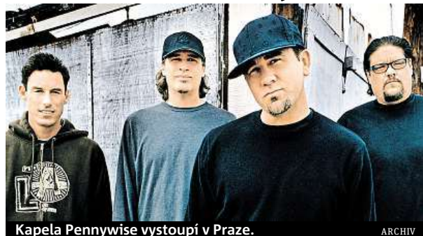
Kapela Pennywise vystoupí v Praze.

Na punkový večírek Prague Sounds Good s kapelami Sum 41, NOFX a Millencolin dorazí i legendy Pennywise.