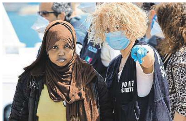
Vlnou imigrantů je zaplavena především Itálie.