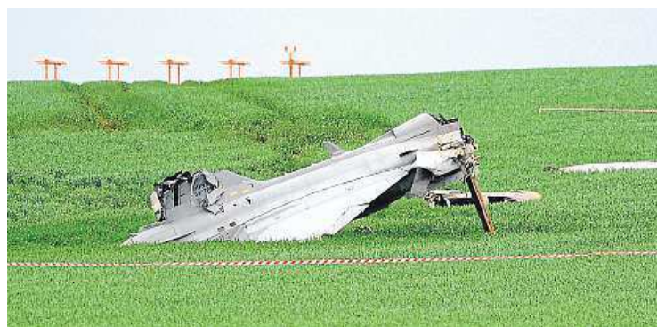
Piloti se museli z letadla katapultovat.

Kuriózní nehoda, naštěstí s dobrým koncem, se stala včera na letecké základně v Čáslavi. Gripen, který letěl z Maďarska na cvičení Lion Effort 2015, při přistání nedobrzdl a skončil v poli. Posádka se stačila katapultovat. „Oba piloti jsou v pořádku a nic dramatického se ve výsledku nestalo,“ řekl mluvčí ministerstva obrany Petr Medek. Nehodu vyšetřuje dozor vojenského letectví a lidé z ministerstva obrany, kteří mají zjistit, zda šlo o chybu pilota, nebo je na vině technická závada letadla.