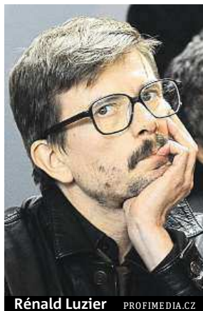
Réald Luzier PROFIMEDIA.CZ

„Každé vydání je utrpením, neboť ostatní nežijí. Trávit bezesné noci vyvoláváním mrtvých a přemýšlením, co by zabití kolegové Charb,