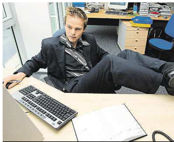
Nebezpečné může být i v kanceláři.

Pracovních úrazů přitom podle nejnovějších statistik meziročně ubývá.