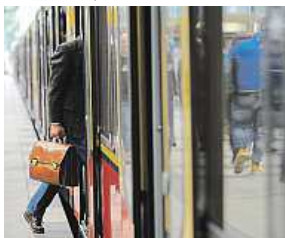
Stávka, ale dokdy?

Bez omezení budou jezdit vlaky z Prahy do Mnichova nebo vlaky z Děčína přes Bad Schandau do Rumburku.