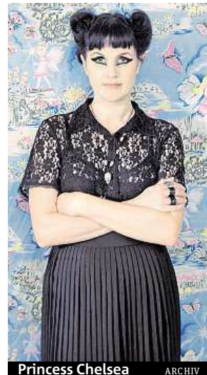
Princess Chelsea

Ostatně pro mnohé náměty, kterými se Chelsea Nikkel alias Princess Chelsea ve svých textech zaobírá, pů-