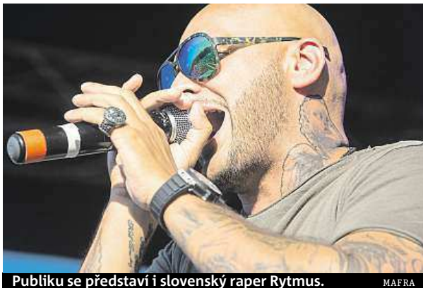
Publiku se představí i slovenský raper Rytmus.

Novinkou letošního, již patnáctého, ročníku je festivalová hymna s názvem Nad Sázvou. Nazpívalo ji seskupení Sáza klan s Bárou Basikovou, Kamilem Stříhalkou, Michalem Malátným a řadou dalších umělců. Sáza-fest nabídne ve Světle nad Sázvou návštěvníkům kromě nového hlavního pořadatele také další hudební scénu a přibude zóna pro návštěvníky s malými dětmi. Sáza-fest se uskuteční od 30. července do 1. srpna ve světelském zámeckém parku. Diváci se mohou těšit na legendy tuzemské populární hudby i zahraniční hosty. Vystoupí německá formace Alphaville,