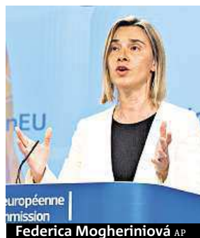
Federica Mogheriniová

a obrany Lubomír Zaorálek a Martin Stropnický uvedli, že Česko by mohlo přispět například vojenskými důstojníky na velitelství budoucí operace. ČTK