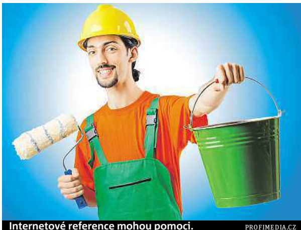
Internetové reference mohou pomoci.

9 z 10 Čechů si myslí, že se někteří obchodníci na internetu neumí dobře prodat. Náročnější jsou přitom hlavně mladí lidé, ve věku do 26 let má nějakou výtku 97 % z nich. „Nastupující generace má na internetovou prezentaci výrazně vyšší nároky. Nevystačí si se základními informacemi o firmě a telefonické