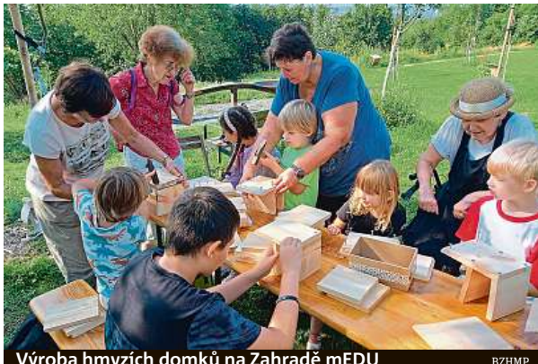
Výroba hmyzích domků na Zahradě mEDU

Botanická zahrada letos přichází s novinkou. Pro aktivní seniory vytvořila program Blahodárná zahrada. Jeho součástí je projekt mezigeneračních setkávání, která si seniory mohou užít společně se svými vnoučaty. Program obsahuje workshopy, komentované prohlídky nebo zkoumání v laboratoři. Aktivitu jsou vedené lektory a představí různé části trojské botanické zahrady. Programy pro seniory začínají už v květnu a konají se až do října. „Úkolem botanické zahrady je vedle představení vzácných a zajímavých rostlin z celého světa, sbírkotvorné činnosti a ochrany rostlinného bohatství a přírody obecně také vzdělá-