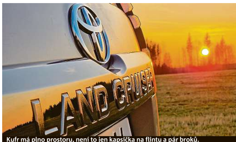
Kufr má plno prostoru, není to jen kapsička na flintu a pár broků.