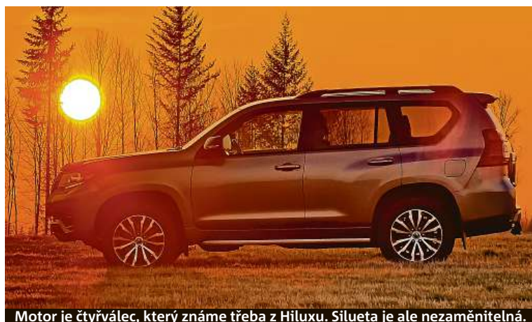
Motor je čtyřválec, který známe třeba z Hiluxu. Silueta je ale nezaměnitelná.