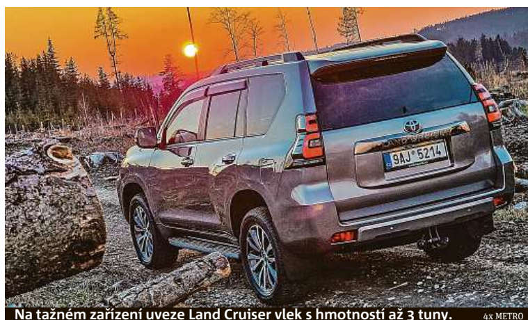
Na tažném zařízení uveze Land Cruiser vlek s hmotností až 3 tuny. 4x METRO