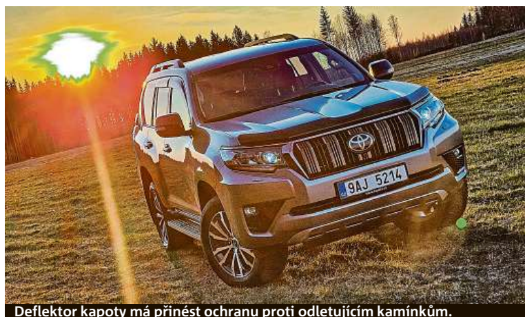
Deflektor kapoty má přinést ochranu proti odletujícím kamínkům.

Nový grafický design vozu Peugeot 9X8 Hypercar vytvořený ve spolupráci s výtvarníkem J. Demským se představil na Milan Design Week. Tento design karoserie se objeví v legendárním závodě 24 hodin Le Mans, který letos oslaví 100. výročí. HOP