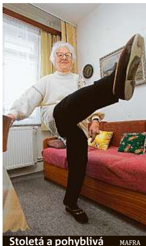
Stoletá a pohyblivá MAFRA

„Například jen částečná asistence v domácím prostředí vyjde až na dvacet tisíc korun měsíčně. Za celodenní péči ve specializovaném zařízení pak snadno zaplatíme až dvojnásobek,“ nastiňuje syrovou skutečnost produktový ředitel Korejs.