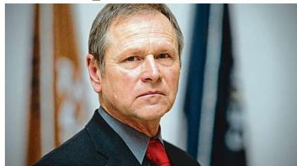
Generál Jiří Šedivý