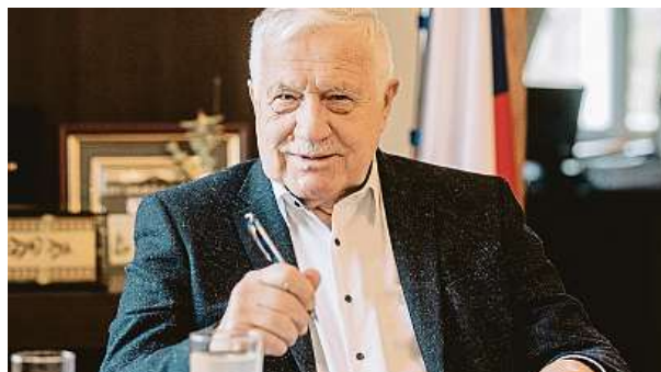
Bývalý prezident Václav Klaus