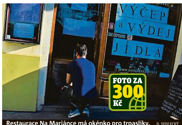
Restaurace Na Marjance má okénko pro trpaslíky. D. SEDLECKÝ