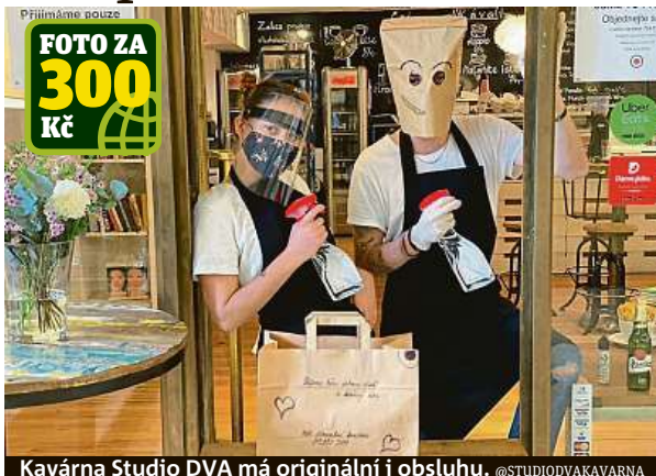
Kavárna Studio DVA má originální i obsluhu. @STUDIODVAKAVARNA

Všechna výdejní okénka si můžete prohlédnout v galerii na Metro.cz. Díky fotkám se také můžete inspirovat, kam vyrazit na dobré jídlo, chutnou kávu nebo točené pivo. Jaká další výzva by se vám líbila? Dejte nám vědět na dopisy@metro.cz! MET