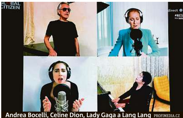
Andrea Bocelli, Celine Dion, Lady Gaga a Lang Lang

Osmihodinová akce One World: Together at Home přinesla hudbu, ale i konkrétní životní příběhy.