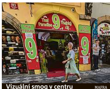
Vizuální smog v centru