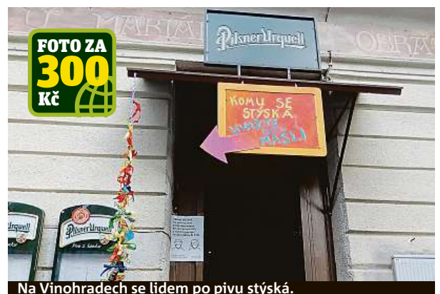
Na Vinohradech se lidem po pivu stýská.