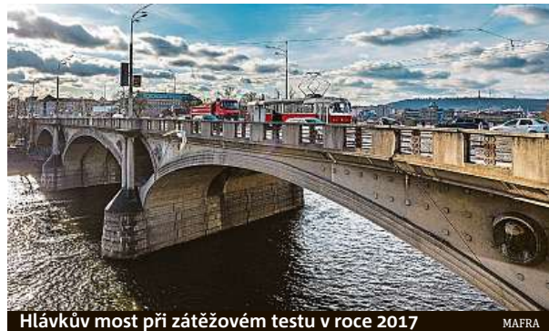
Hlávkův most při zátěžovém testu v roce 2017