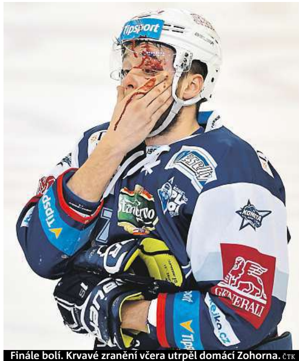
Finále bolí. Krvavé zranění včera utrpěl domácí Zohorna. ČTK

Zápas nedochytila jejich jednička, po čtvrtém inkasovaném gólu se Šimon Hrubec nechal vystřídat Peterem Hamerlíkem. IDNES.cz