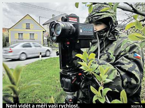
Není vidět a měří vaši rychlost.