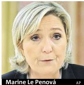
Marine Le Penová

Volby jsou unikátní ve dvou ohledech. Prezident Hollande se neuchází o druhé funkční období, a navíc je možné, že druhé kolo voleb