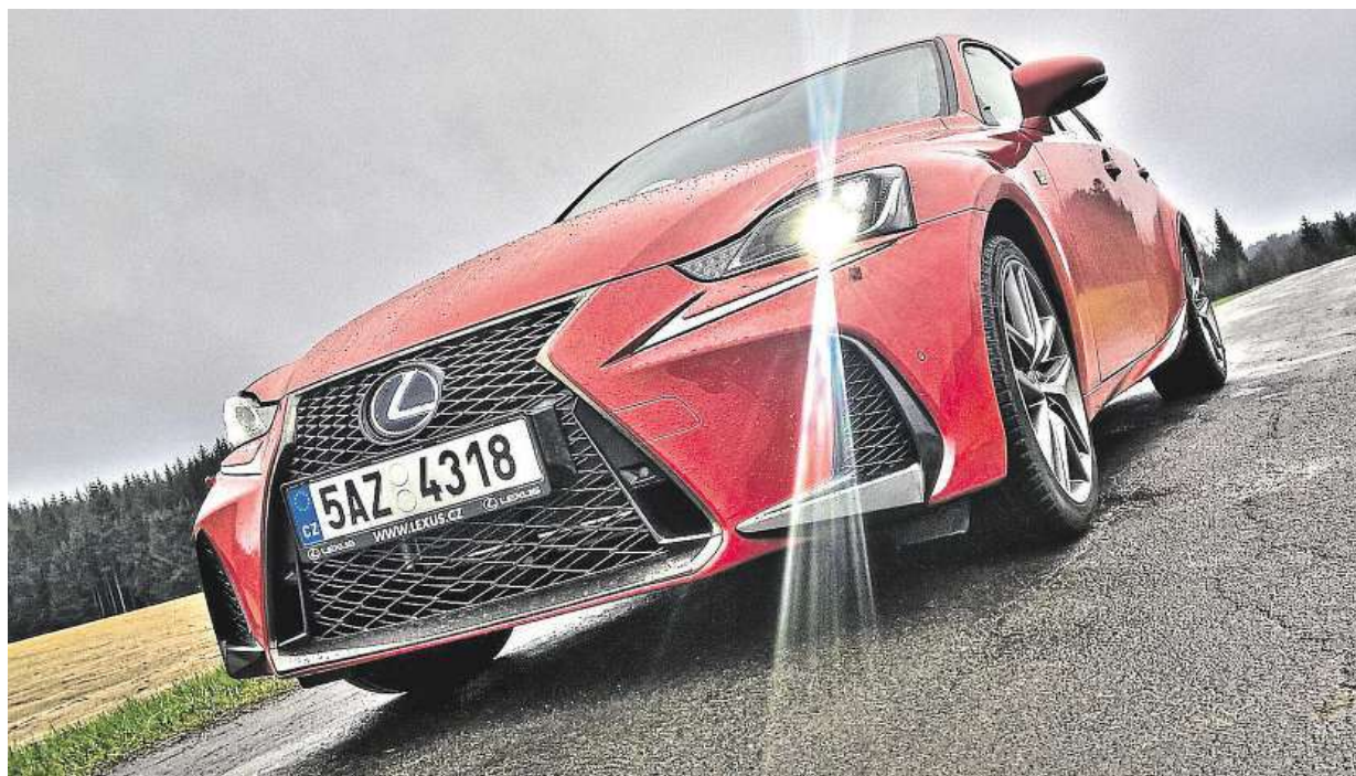
Jako pohled dravce. Maska dostala ostřejší design, což prospělo světlům i nárazníku.