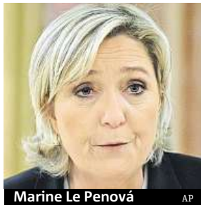
Marine Le Penová

Volby jsou unikátní ve dvou ohledech. Prezident Hollande se neuchází o druhé funkční období, a navíc je možné, že druhé kolo voleb