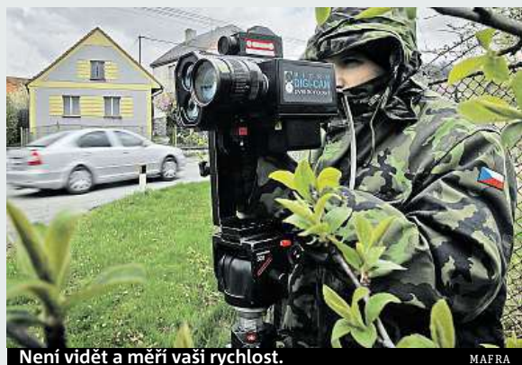
Není vidět a měří vaši rychlost.