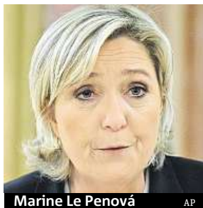
Marine Le Penová

Volby jsou unikátní ve dvou ohledech. Prezident Hollande se neuchází o druhé funkční období, a navíc je možné, že druhé kolo voleb