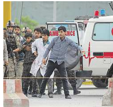
Pomoc obětem útoku v Kábulu