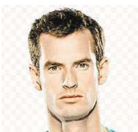
Andy Murray ATP

Britský tenista měl několikrát podezření, že jeho soupeř užíval doping. Nikoho nejmenoval.