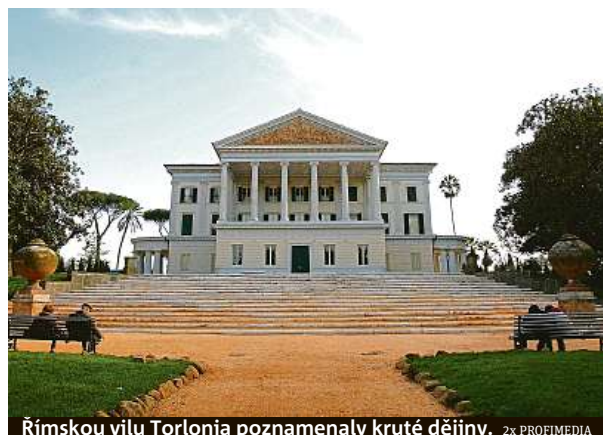
Římskou vilu Torlonia poznamenaly kruté dějiny.

„Stavební práce by měly začít během pár týdnů,“ uvedl pro agenturu ANSA architekt