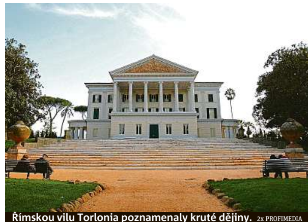
Římskou vilu Torlonia poznamenaly kruté dějiny.

„Stavební práce by měly začít během pár týdnů,“ uvedl pro agenturu ANSA architekt