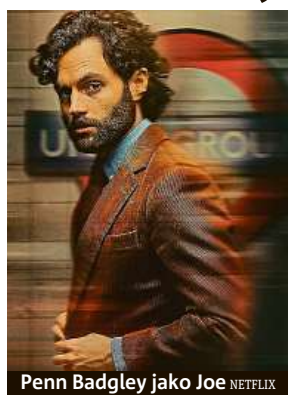
Penn Badgley jako Joe NETFLIX

Ještě se tam řeší další holky, mrtví šamstrové a podobně, ale nejdůležitější je, že se poté, co se jeho problémové manželství s Love ehm řekněme rozpadne, hlavní antagonista se přesouvá ze Spojených států do Londýna. Zde začíná pod jménem Jonathan Moore (jak nenápadné) nový život coby profesor na univerzitě. Joe chce v Londýně, kde se převážně odehrává i ak-