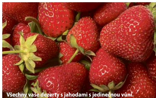
Všechny vaše dezerty s jahodami s jedinečnou vůní.