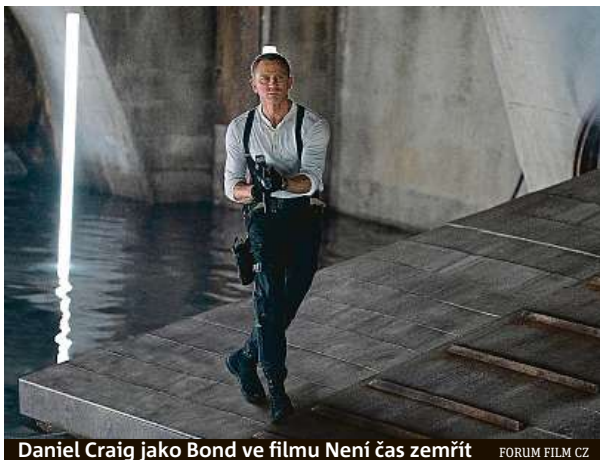
Daniel Craig jako Bond ve filmu Není čas zemřít

Pozitivní diagnózu na tento zákeřný virus před několika dny oznámili také bývalá bond girl – herečka ze snímku Quantum of Solace Olga Kurylenková – nebo zvažovaný nástupce současného Bonda Daniela Craiga, herec Idris Elba. Premiéra aktuálního bondovky s názvem Není čas zemřít se nepovedl zdaleka tak, jak jeho tvůrci a fanoušci agenta 007 doufali, a herec Daniel Craig dával vcelku hlasitě najevo, že nebyl s filmem spoko-