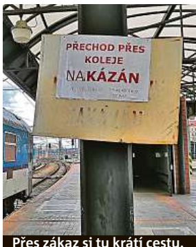
Přes zákaz si tu krátí cestu.

„Největším přínosem stavby je podstatné zkrácení docházkových časů z hlavního nádraží do městských částí Praha 2 a 3. Prodloužení podchodu bude řešeno tak, aby bylo možné rozšířit nádraží o další ostrovní nástupiště. Vyústění pěší trasy pak bude situováno do ulice Seifertova. Napojení výstupu směrem na Prahu 2 bude navrženo do ulice Vinohradské formou chod-