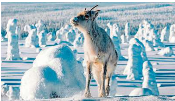
Sobík putoval mrazivou krajinou Laponska.

Film Putování se sobíkem bude v kiněch už od zítřka.