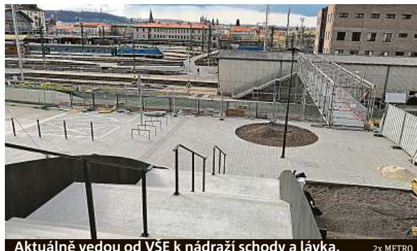
Aktuálně vedou od VŠE k nádraží schody a lávka.

Trasu podchodu upřesňuje mluvčí Prahy 3 Michaela Luňáčková: „Stávající podchod se prodlouží za poslední kolejiště, odsud se půjde chodníkem směrem k Seifertově ulici. Po schodech bude možné odbočit skrz náměstí Winstona Churchilla směrem na Italskou a k VŠE.“