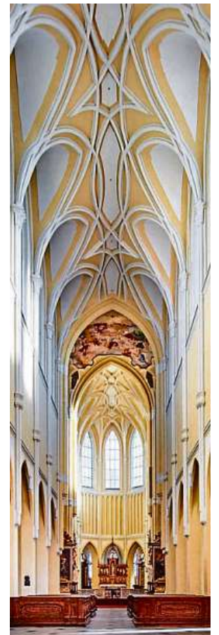
Uvnitř katedrály