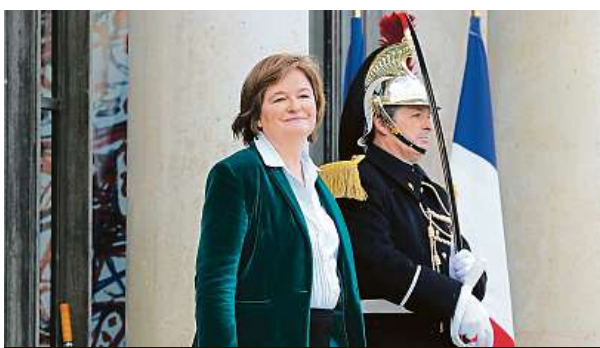
Ministryně Nathalie Loiseauová

„Začala jsem svému kocourovi říkat Brexit. Každé ráno mě vzbudí mňoukáním, protože chce ven z pokoje. Když mu otevřu, zůstane nerozhodně ve dveřích. Když ho dám