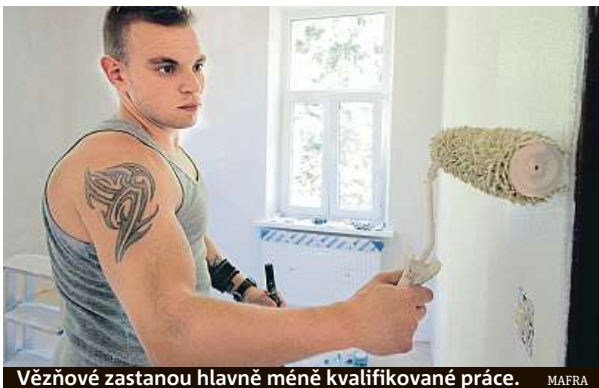
Vězňové zastanou hlavně méně kvalifikované práce.