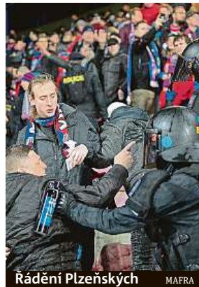
Rádění Plzeňských MAFRA

Expertní skupina se sejde znovu za dva týdny. Resort v současnosti dokončuje text