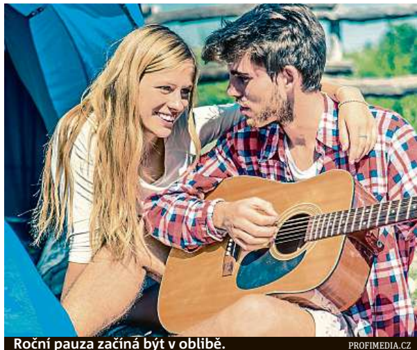
Roční pauza začíná být v oblíbě.

I přesto, že gap year není v Česku zatím rozšířeným fenoménem, možnosti je spousta. Většina programů je totiž mezinárodní. A pokud mladý člověk nemá peníze, je tu i možnost vycestovat jakožto dobrovolník. Mezinárodní dobrovolnické kempy nabízí například nezisková organizace Inex-SDA. Ta dokonce pořádá i setkání, kam si zájemci mohou přijít pro informace. ANNA PORTEŠOVÁ