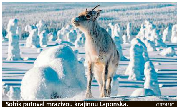
Sobík putoval mrazivou krajinou Laponska.

Hrdinou je malý sob Ailo. Právě se narodil v Laponsku, což je krajina na severu Evropy, jejíž největší část leží až za polárním kruhem. Nezní to moc povzbudivě. Takový sobík si ale na drsné podmínky snadno navykne. Hned po narození se dokáže rychle postavit na nohy, stačí mu na to pouhých pět minut. Za dalších pět minut se naučí chodit a do čtvrt hodiny umí plavat i pelášit sněhem.