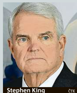
Stephen King