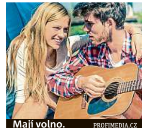
Mají volno.

pořádá i setkání, kam si zájemci mohou přijít pro informace. ANNA PORTEŠOVÁ