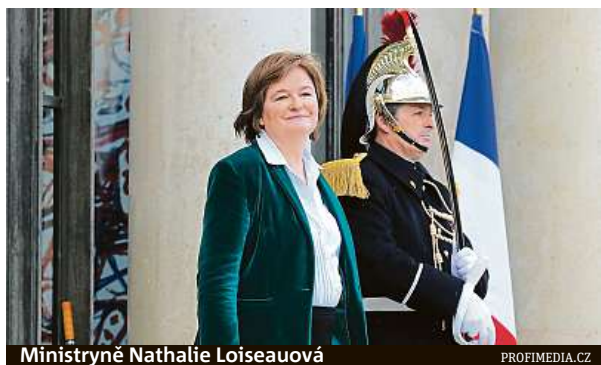
Ministryně Nathalie Loiseauová

„Začala jsem svému kocourovi říkat Brexit. Každé ráno mě vzbudí mňoukáním, protože chce ven z pokoje. Když mu otevřu, zůstane nerozhodně ve dveřích. Když ho dám